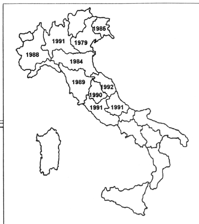
Distribuzione della Metcalfa pruinosa in Italia. Gli anni si riferiscono alle prime segnalazioni in ciascuna regione.

Metcalfa pruinosa inoltre, se si escludono alcuni predatori generici, non ha trovato in Italia un nemico