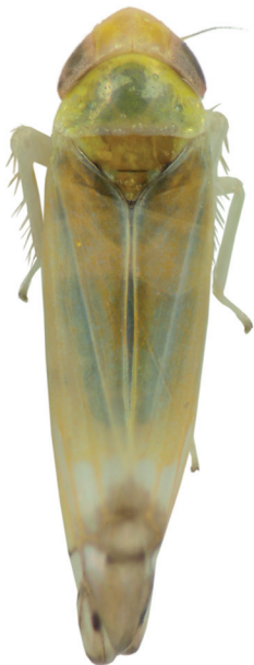
Figur 4. Zyginella pulchra . Lever på tysklönn, och var närmast tidigare funnen just i Tyskland.

Also a species found in Skåne with nearest earlier record in Germany.