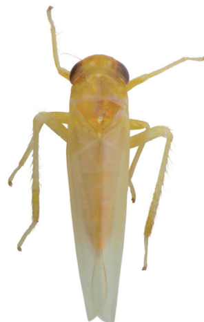
Figur 3. Kybos limpidae . Närmast funnen i Tyskland tidigare.

A species that has colonised Sweden from the south.