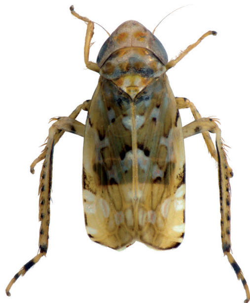
Figur 5. Metalimnus obtusus har till skillnad från de andra avbildade arterna invandrat till Sverige från öster.

Also a species found in Skåne with nearest earlier record in Germany.