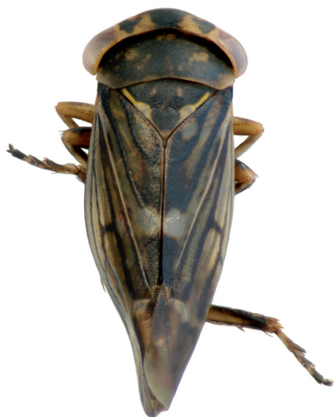
Figur 1. Balacancerus larvatus . En sydeuropeisk art som oväntat hittats i Skåne.

A south European species that unexpectedly was found in Skåne.