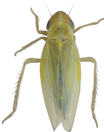
Figur 2. Dikraneurus variata . Hitades ny för Sverige vid Vomb i Skåne.

A south European species that unexpectedly was found in Skåne.