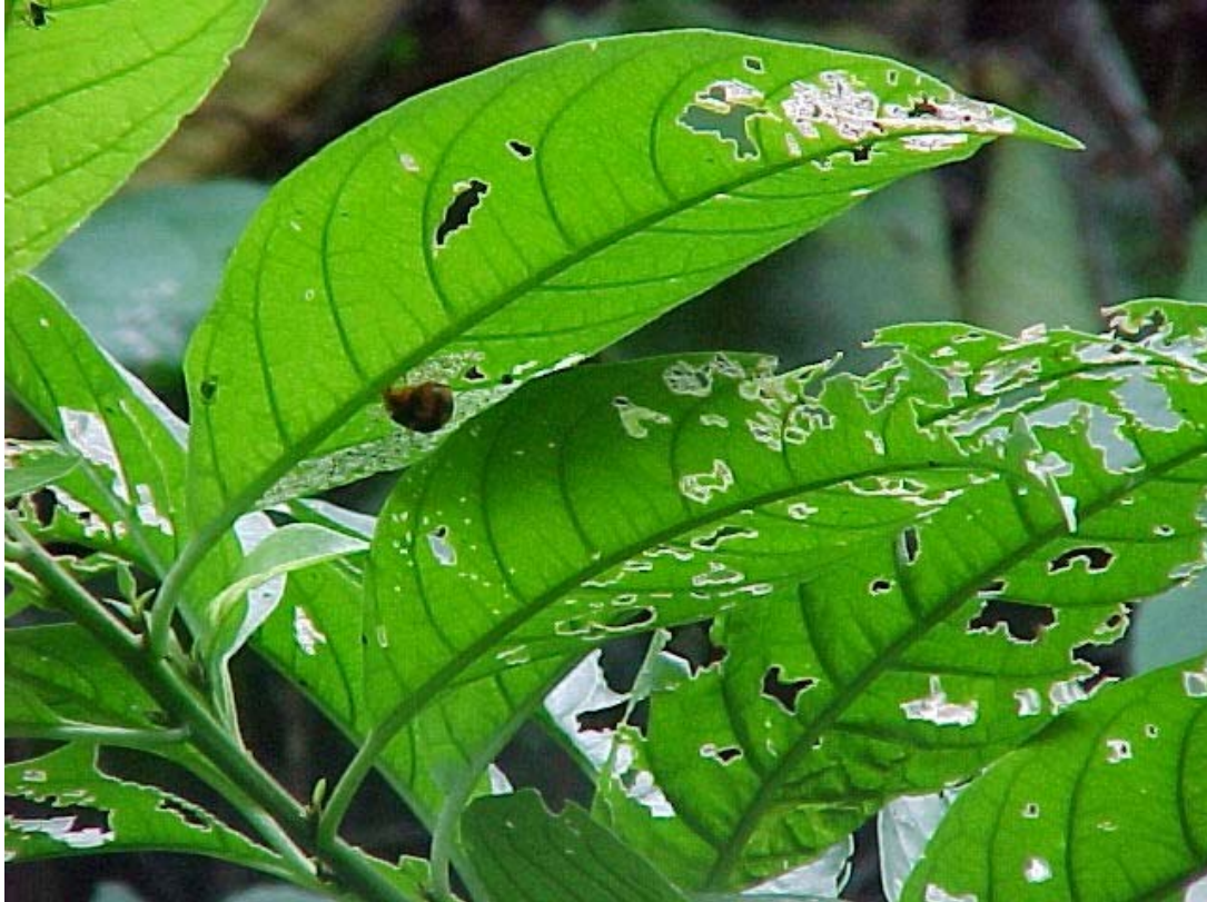
Epilachna sobre su planta hospedera.