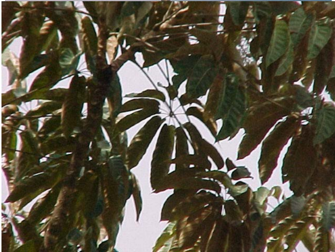
mano de león, Philodendron warszewkii