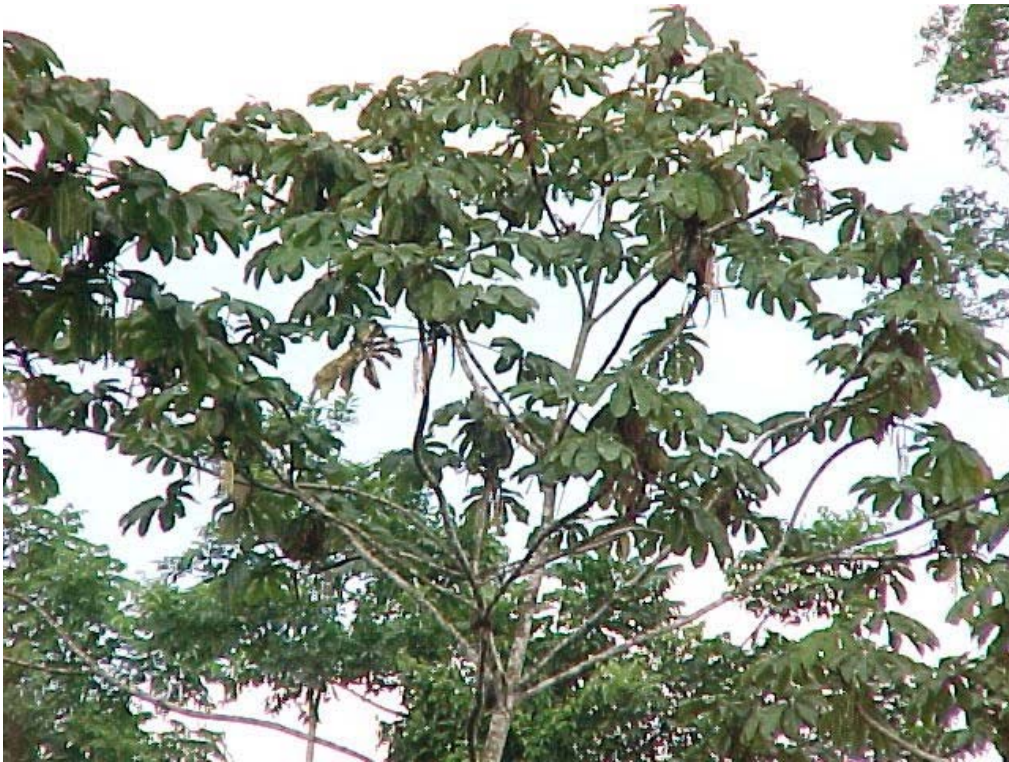
guarumos extendiendo sus "manos" sobre el paisaje