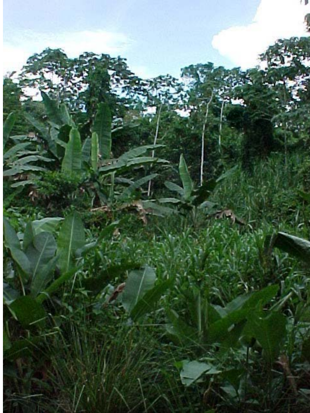
presencia cercana del bosque alrededor del centro