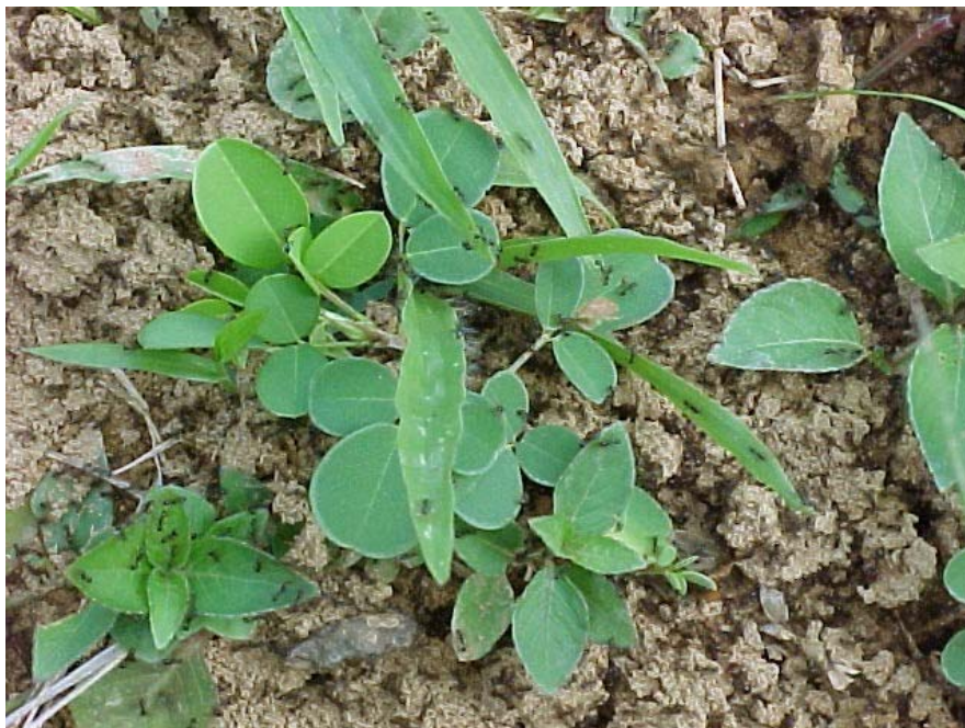
maní forrajero, abono verde