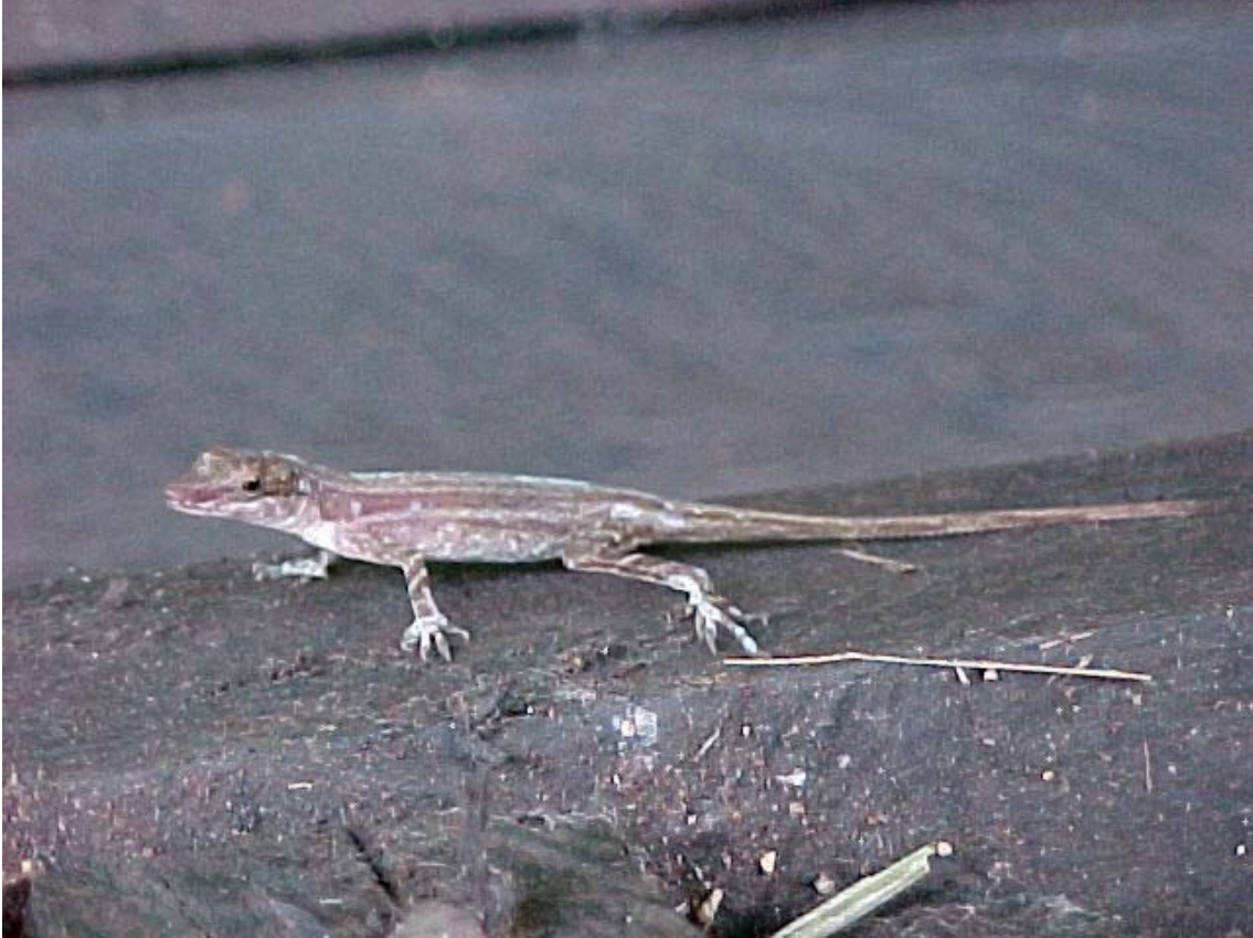
lagartija del género Norops

Dantos, jaguares, venados, chanchos de monte, monos congo y muchas especies de aves están presentes en los bosques circundantes del CICABO. Muchas aves u reptiles entran en el CICABO mismo.