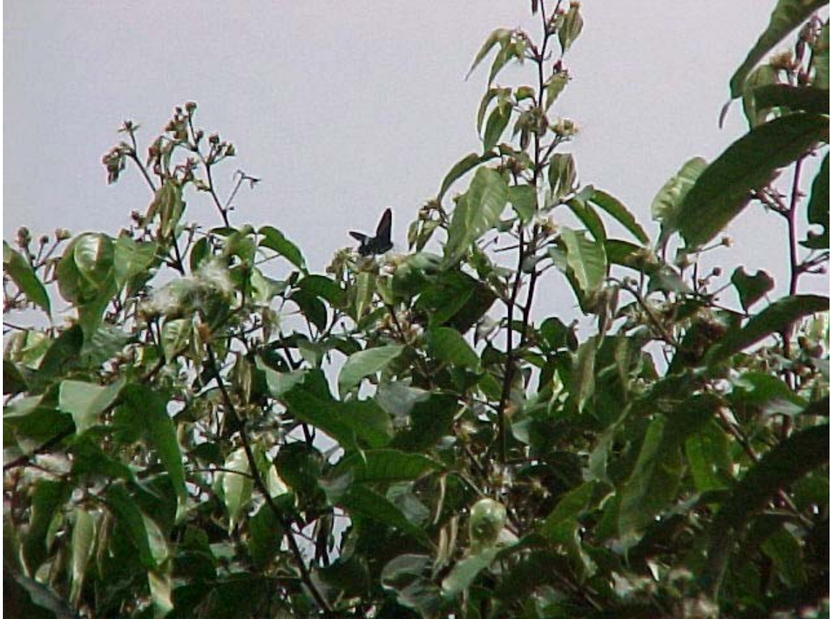
flores de Inga , atractivas para las Urania