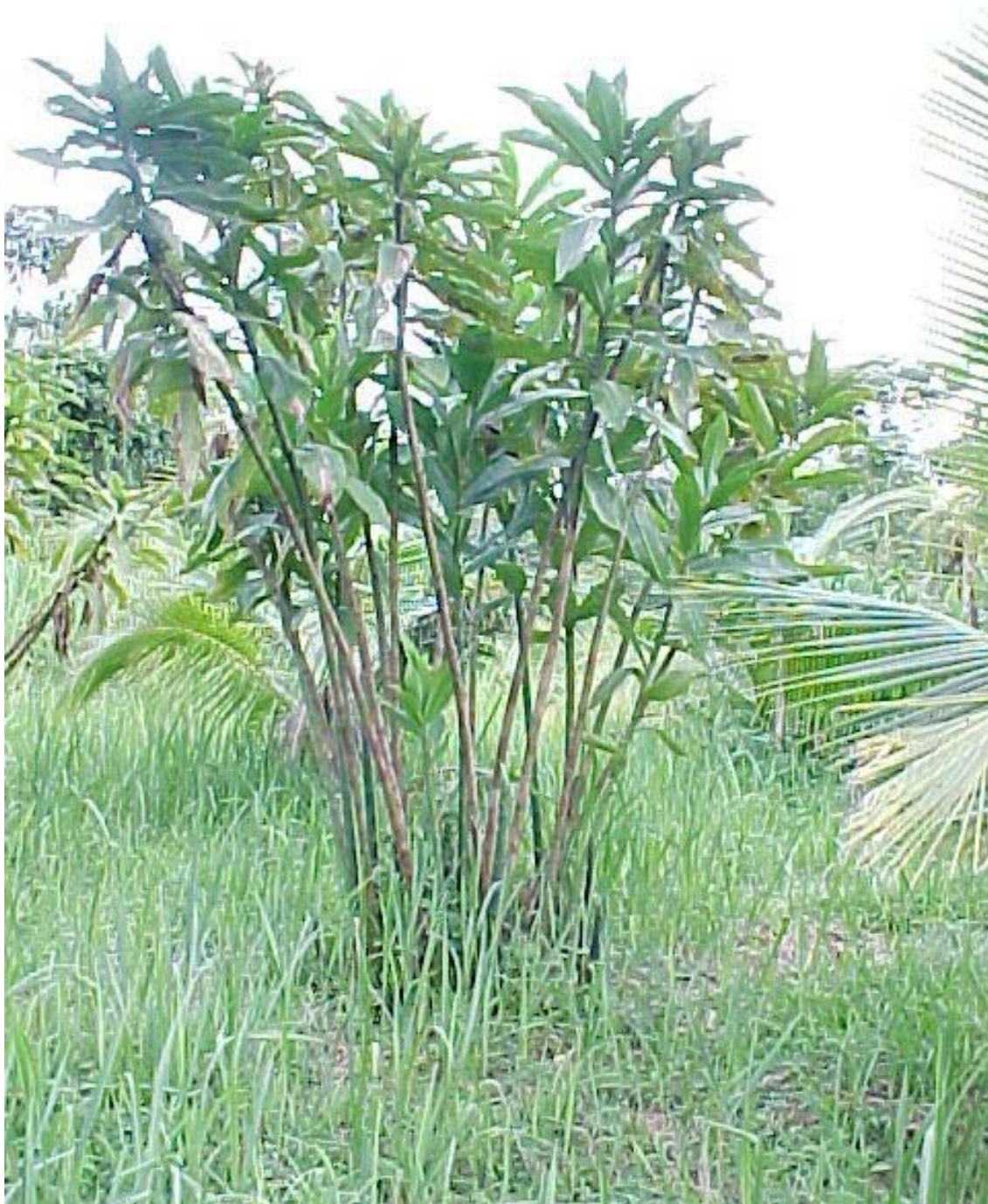
caña agria, planta medicinal, también ornamental