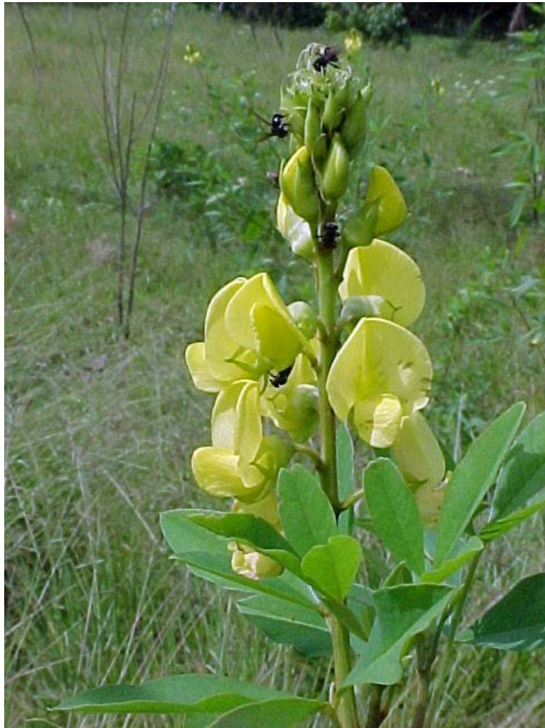
flores de abejón con abejitas ( Trigona ) butinandolas