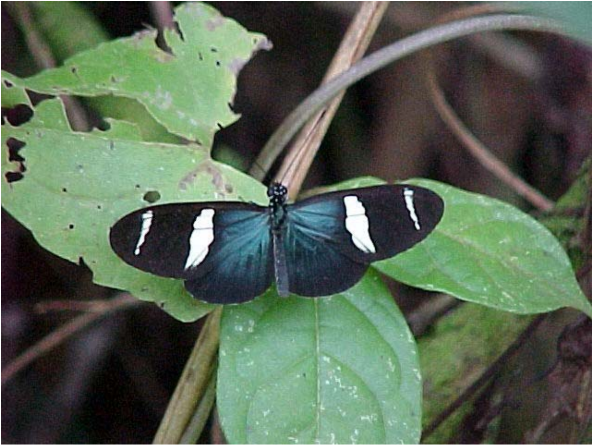
Heliconius sara , alegrando el ambiente