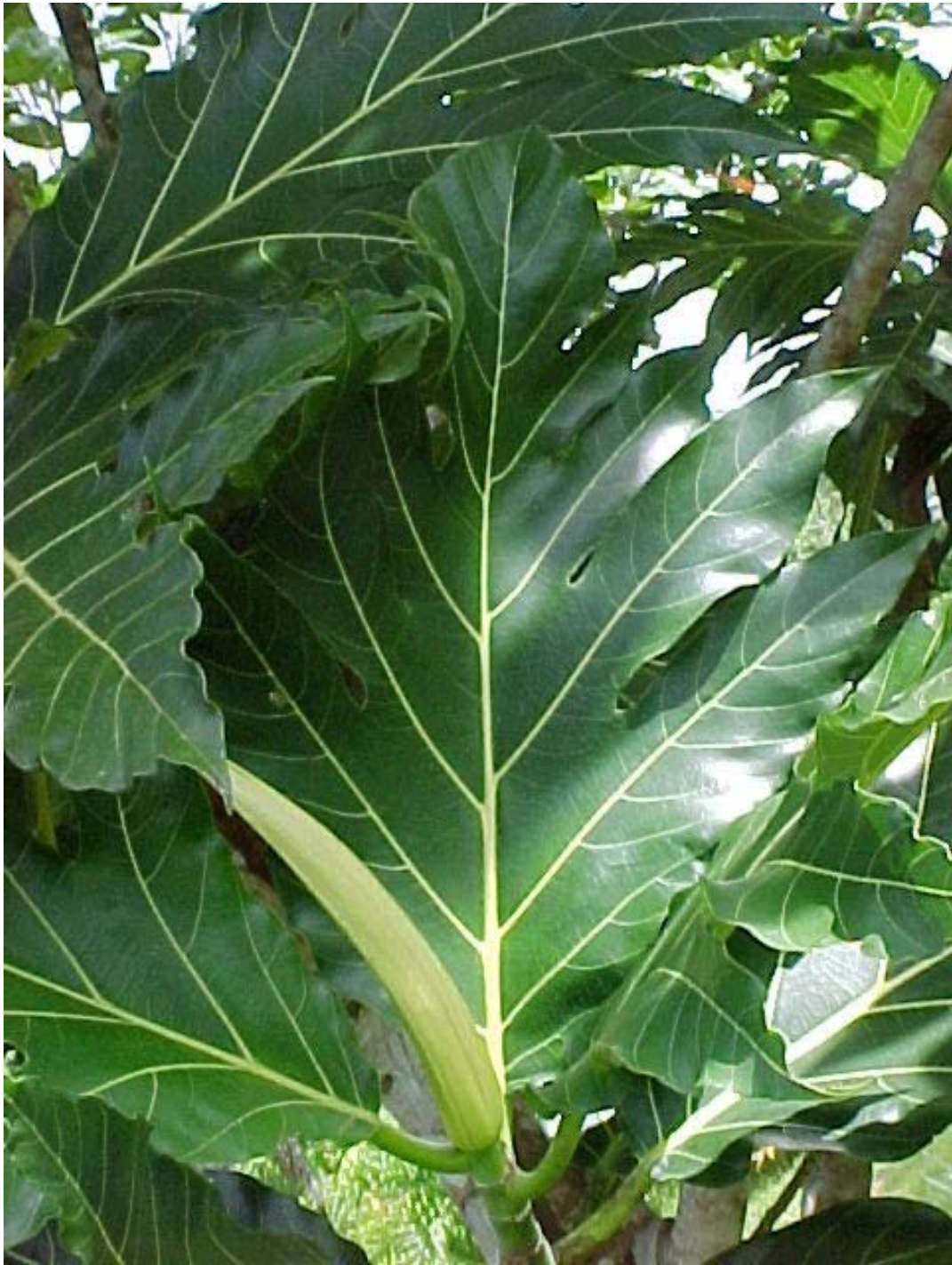
fruta de pan