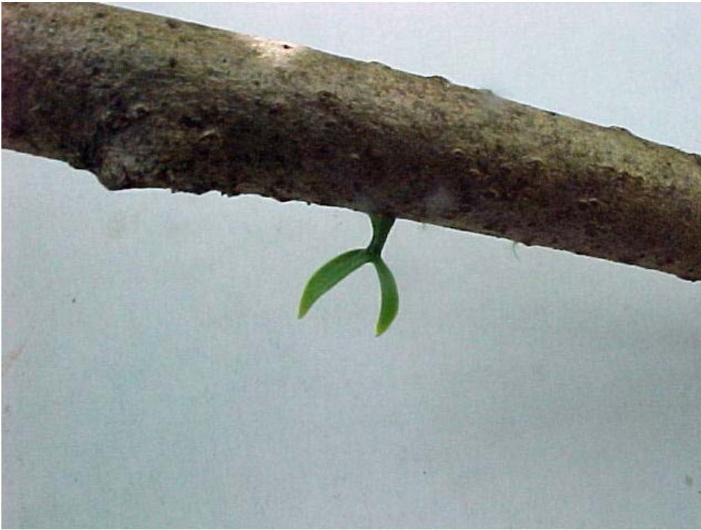
planta parasita recién nacida