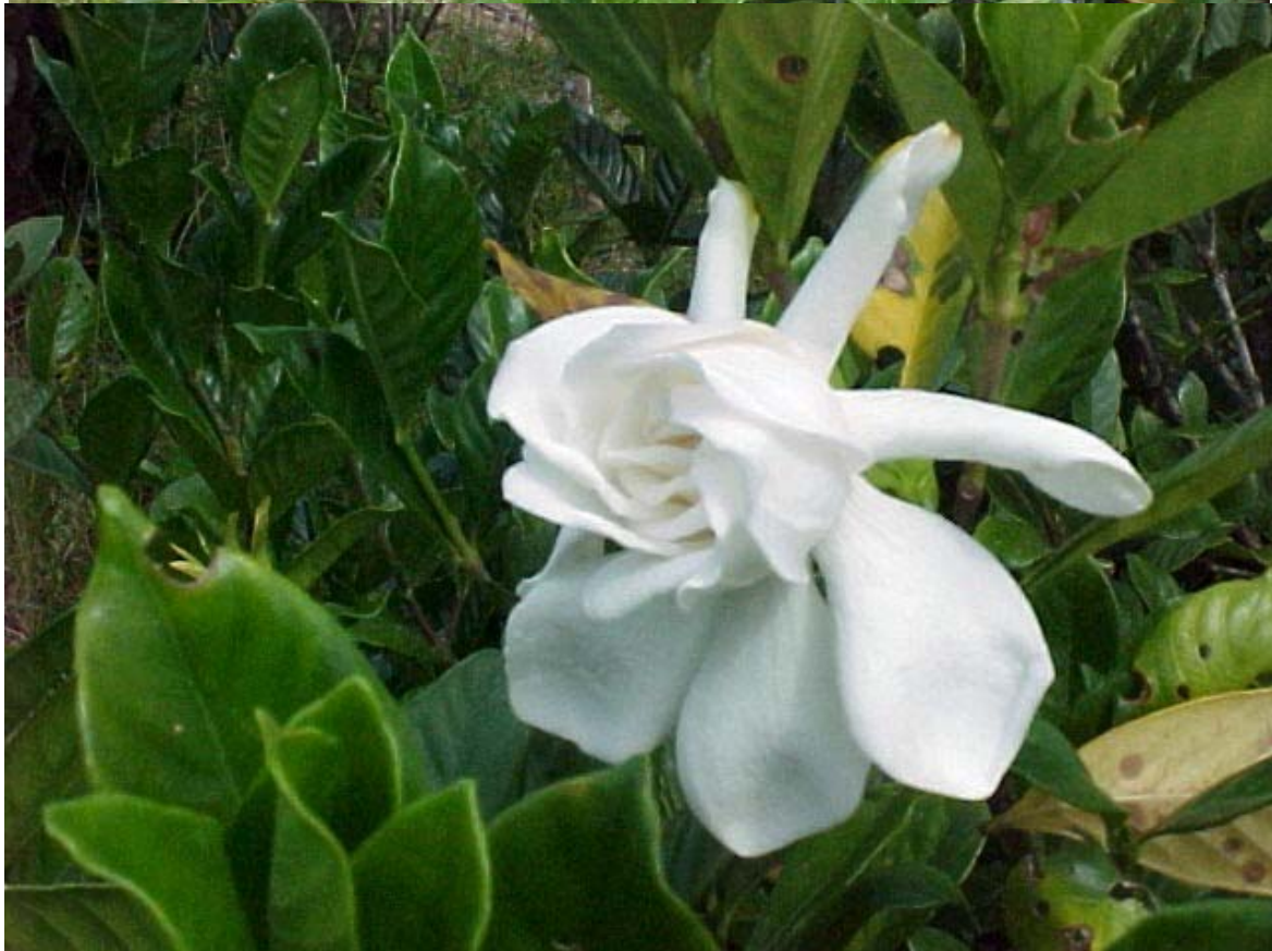
gardenia o jasmín exótico, la belleza y la fragancia en una sola flor.