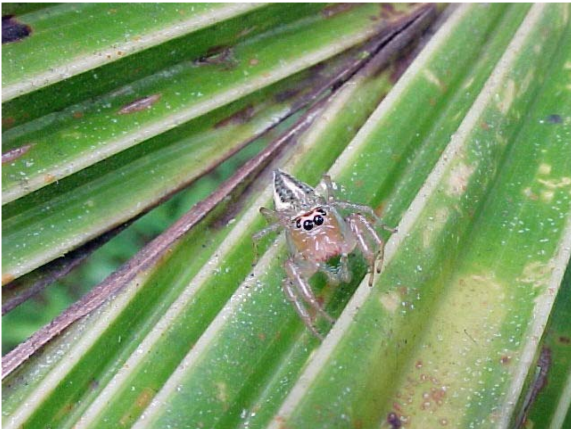
Para el observador de cosas más pequeñas, un Salticidae, arañita cazadora