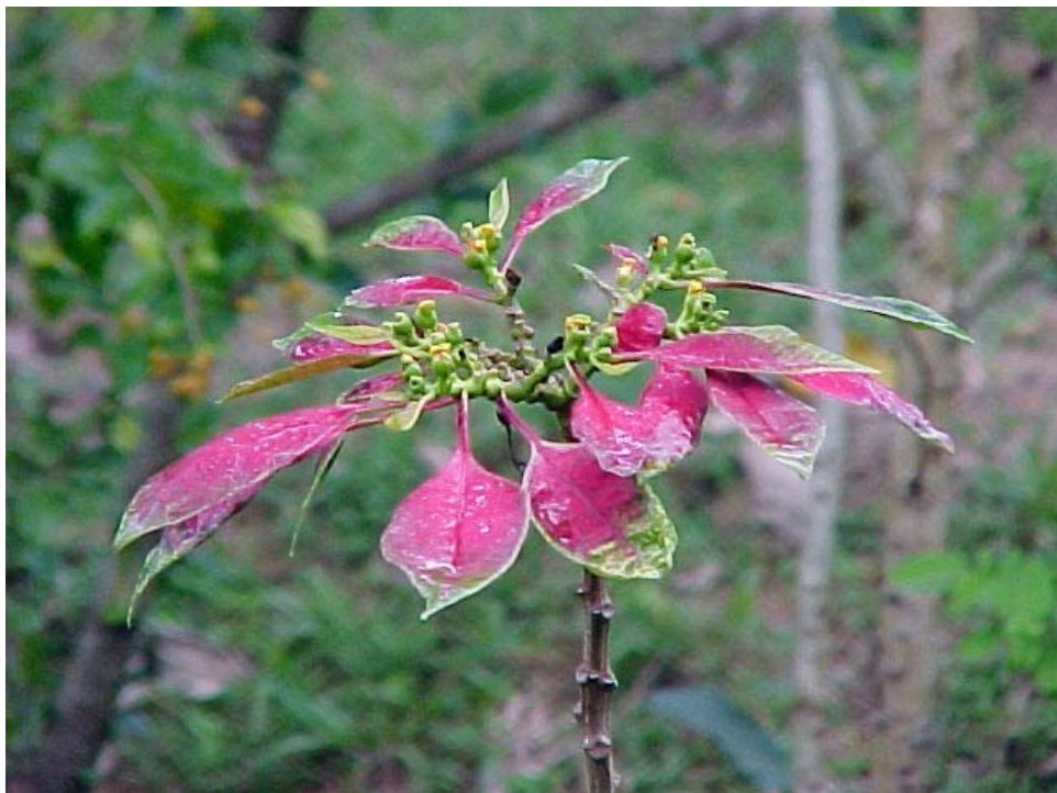
flor de navidad o flor de pascua