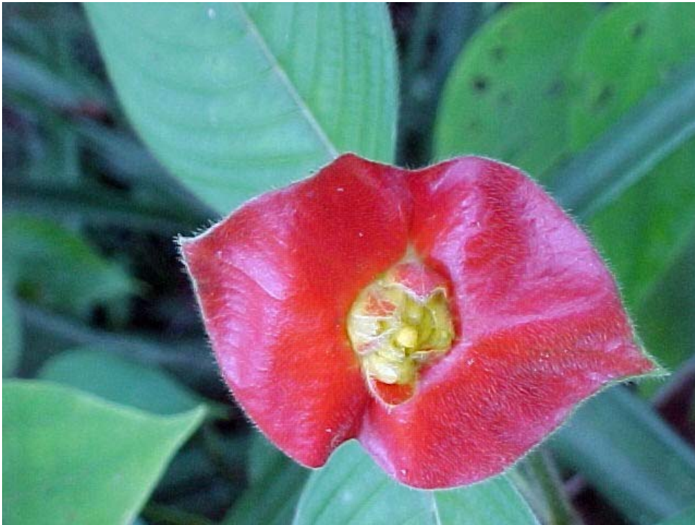
flores llamadas "labios de mujer"