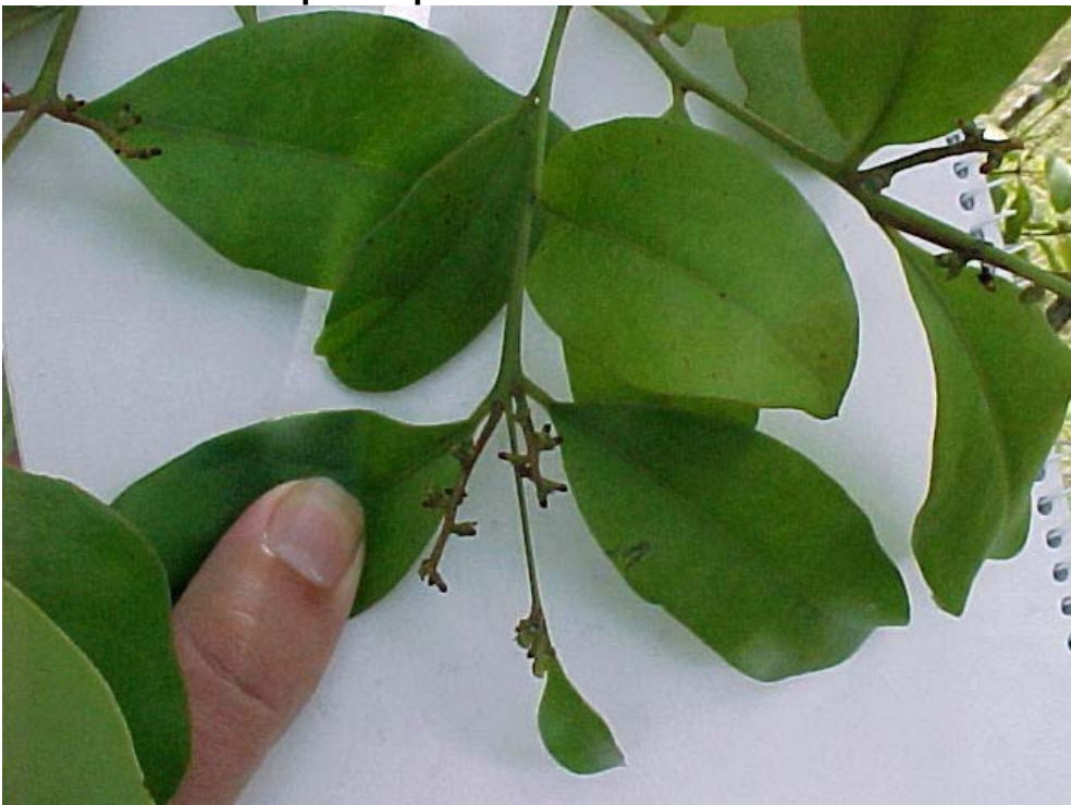
... y luego ya crecida ...