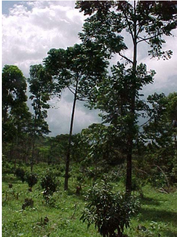
cultivos entre árboles grandes