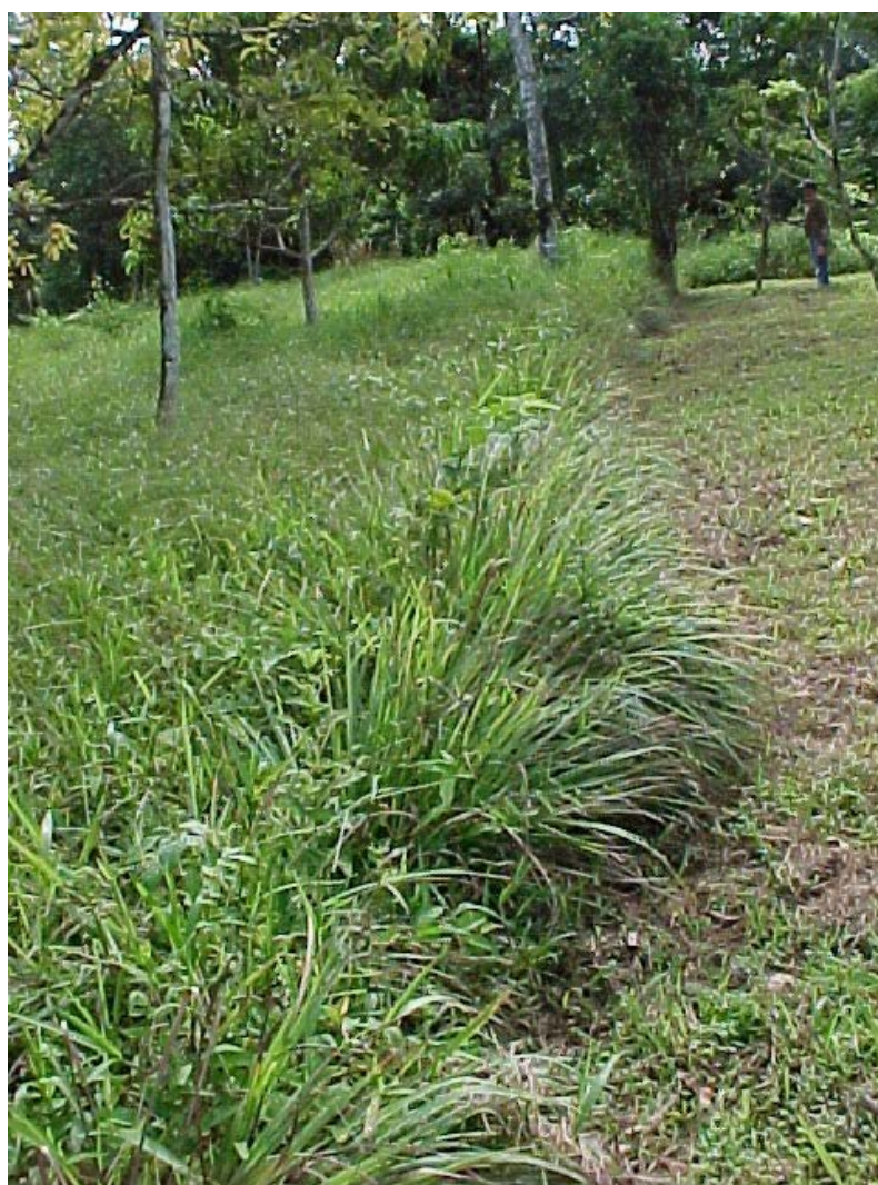
zacate limón, ornamental y medicinal