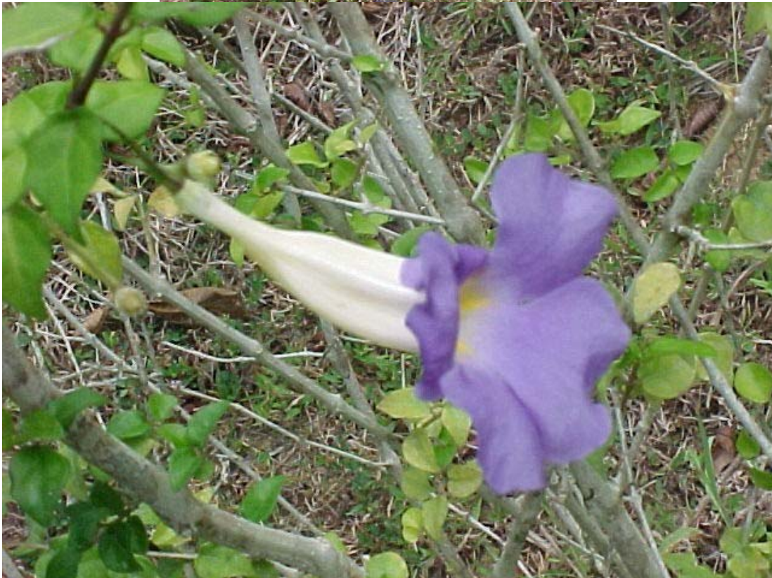
enredadera con flores parecidas a campanitas