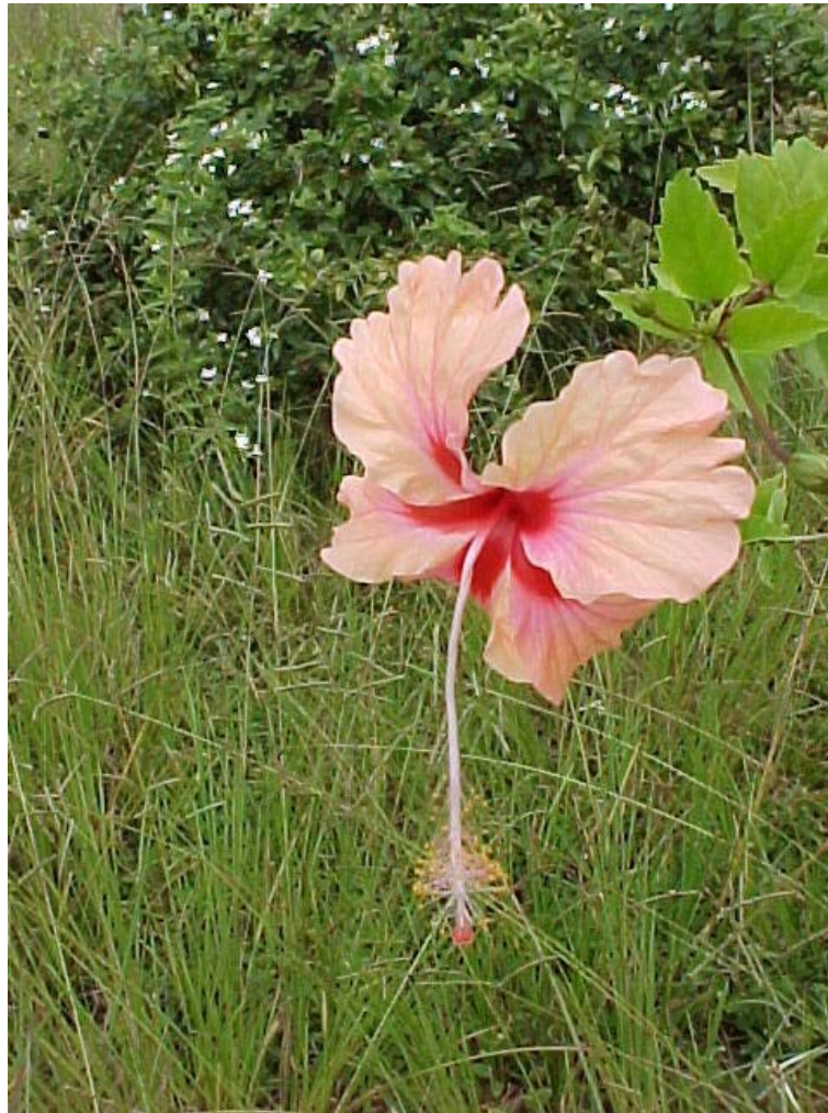
Hibiscus , flor de avispa