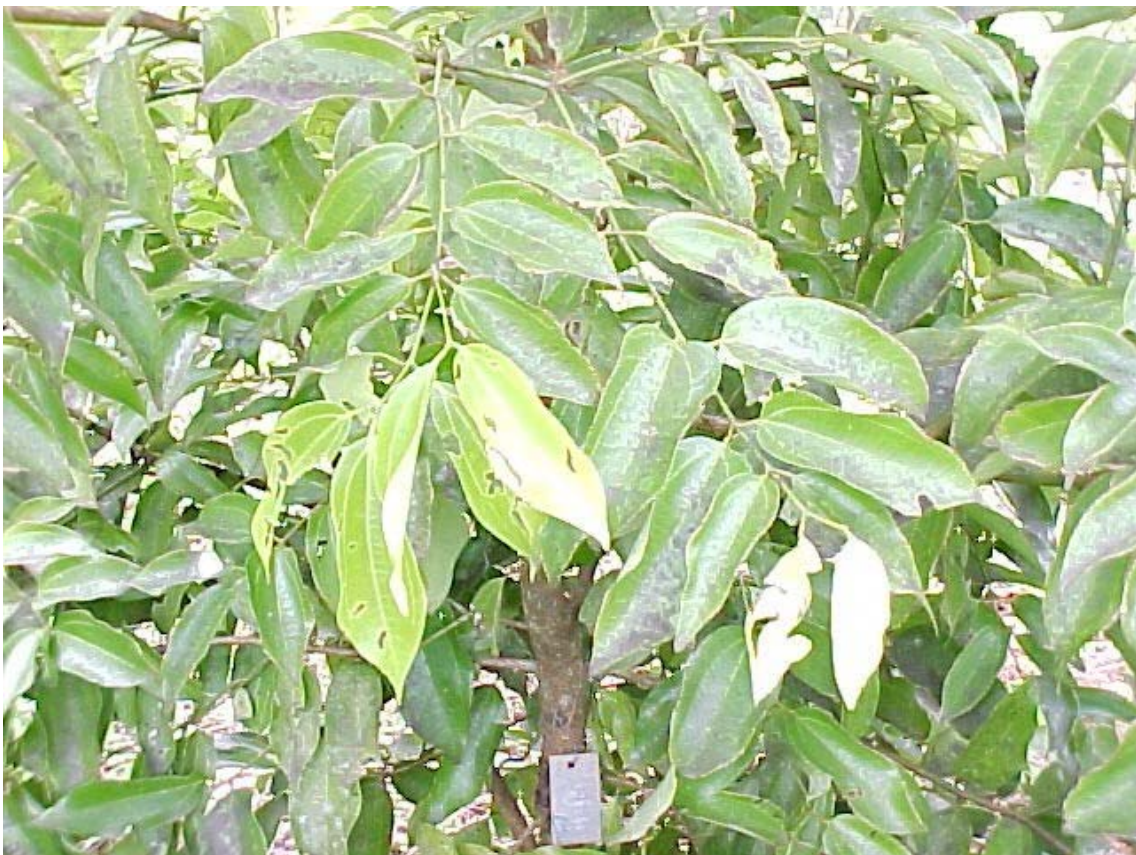
Daños leve de defoliadores.