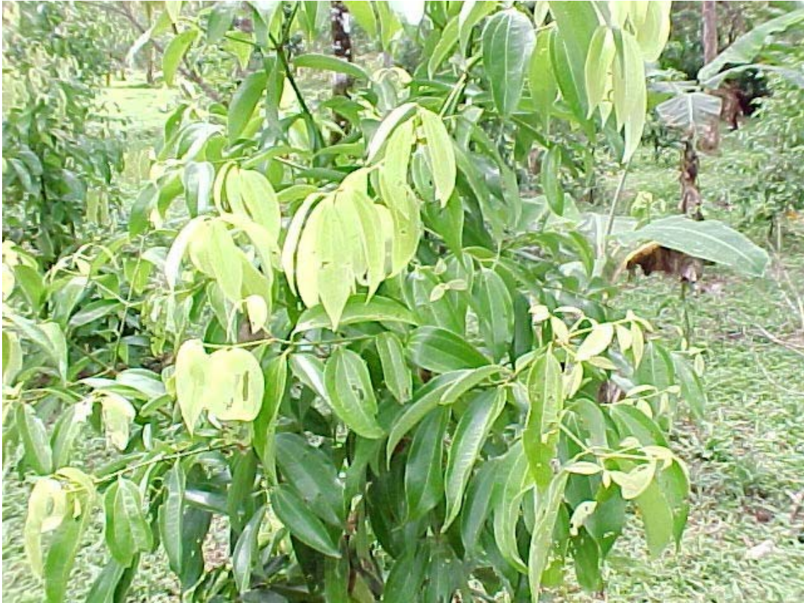
Follaje de canela.