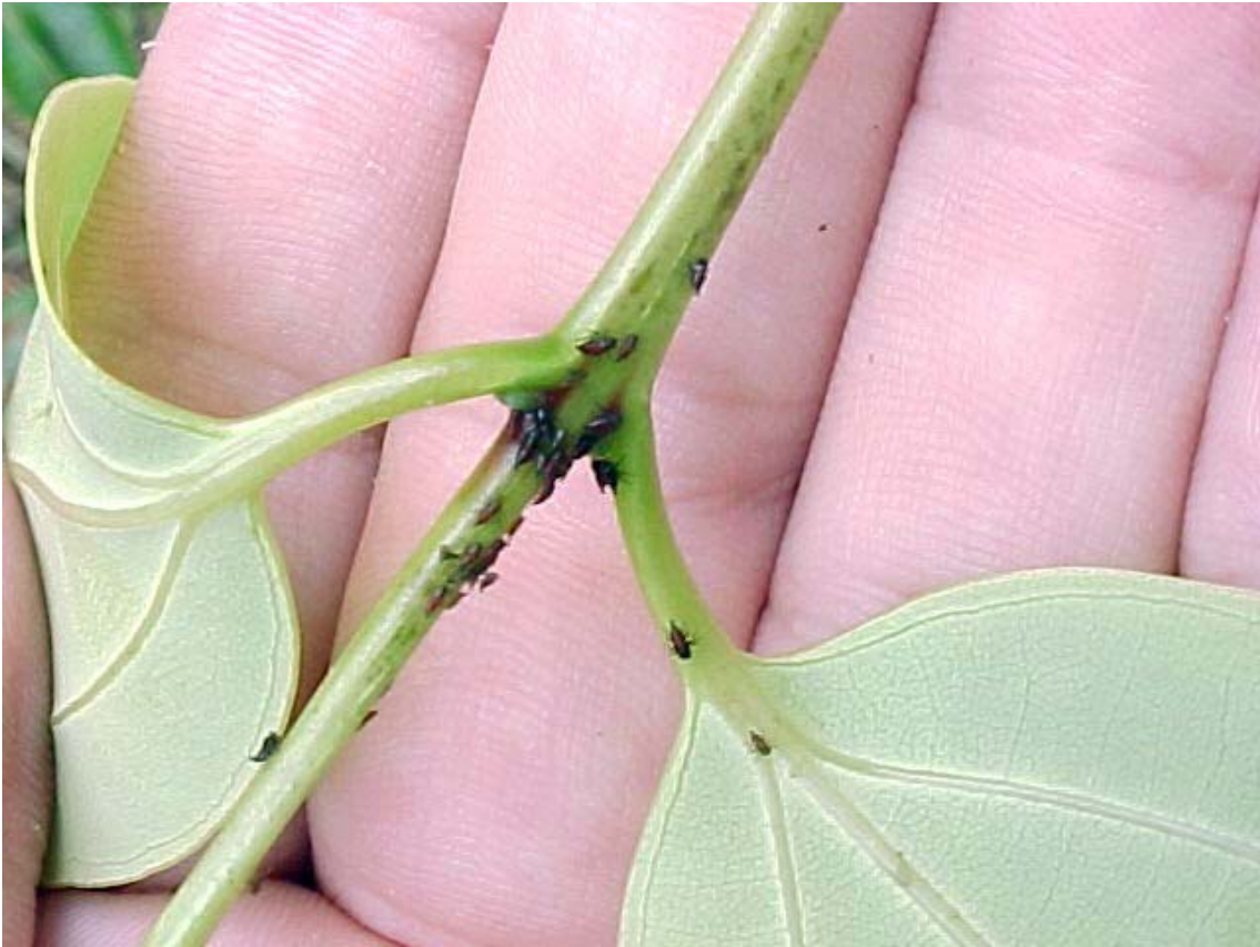
Ninfas de Membracidae en canela.