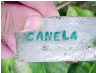
Canela, Cinnamomum verum (= Cinnamomum zeylanicum ).

Se pudieron observar daños foliares leves y presencia de grupos de Membracidae (toritos). Ninguno de estos daños es significativo.