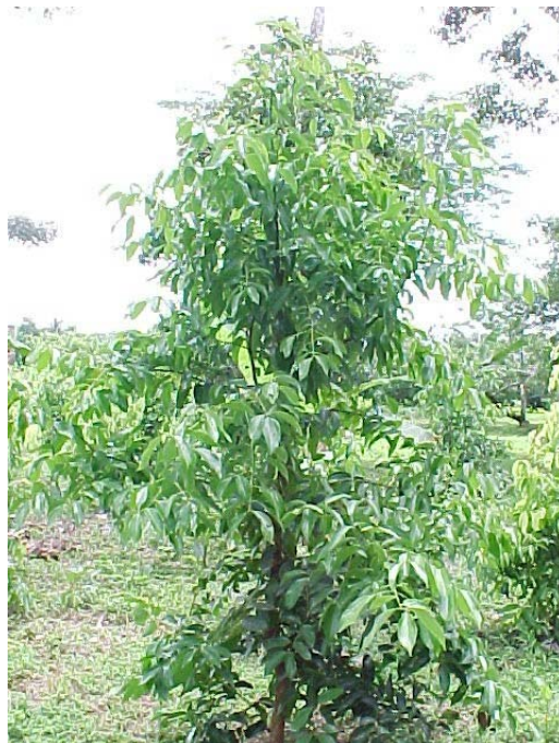
Planta de canela.