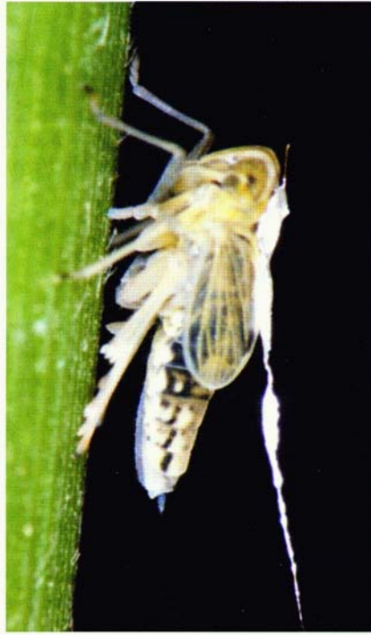
图5 电子记录白背飞虱取食和产卵行为时金线(直径 20\ \mu\text{m} )连接于白背飞虱短翅型雌成虫的中胸背板上

Fig. 5. A gold wire ( \phi 20\ \mu\text{m} ) was attached to the dorsum of a brachypterous female of S. furcifera when electronically recording its feeding and ovipositional behavior.