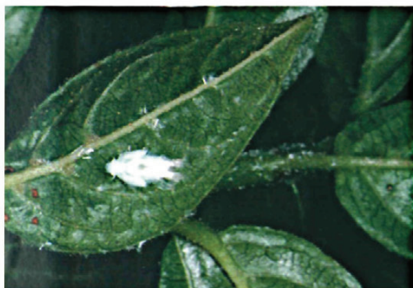
Fig. 6.—Nínfa de M. pruinosa recubierta de su secreción cerosa.

donde se aparean. Las ninfas (Fig. 6) aparecen a final de mayo de una forma escalonada y están presentes hasta mediados de agosto.