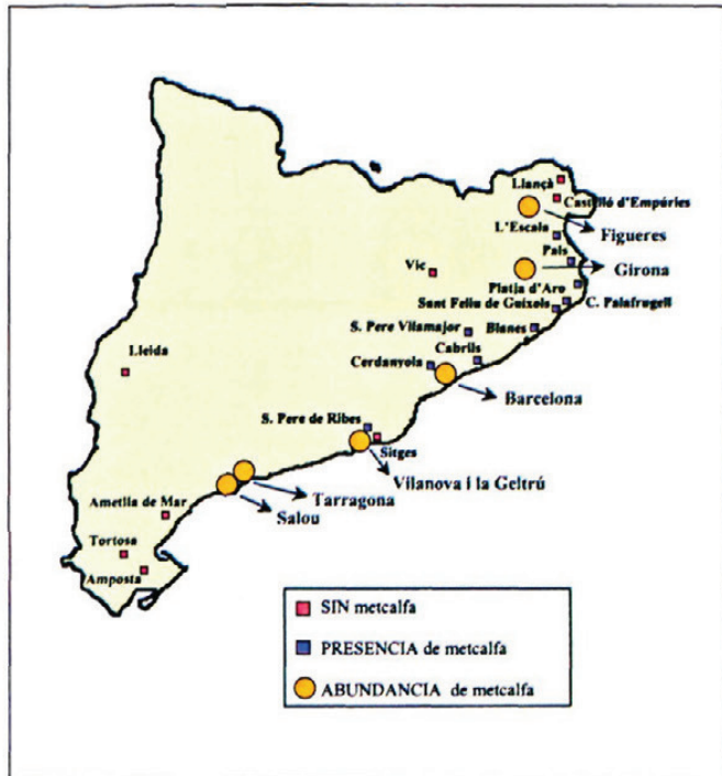
Fig. 1.—Localidades donde se ha llevado a cabo la prospección de M. pruinosa .

sur de Suiza (JERMINI et al. , 1995). La vía de colonización de nuevas áreas se produce a través del transporte de materiales infestados o simplemente se debe al tráfico de vehículos por carretera, en los que algunas formas del insecto se pueden refugiar. La dispersión de la especie se debe a la actividad de vuelo de los adultos.