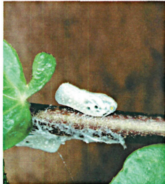
Fig. 4.—Adulto de M. pruinoso sobre hiedra.