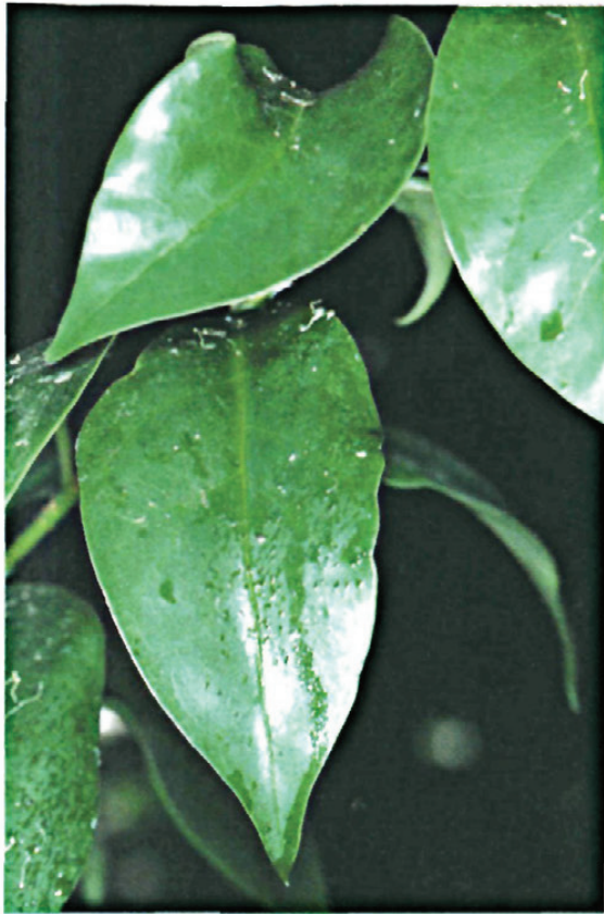
Fig. 2a.—Daños producidos por M. pruinoso . Melaza sobre hoja de ligustrum.