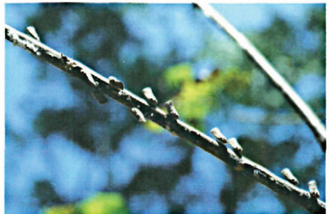
Fig. 5.—Adultos dispuestos en hilera sobre una rama de avellano.

observado una única generación anual. Los adultos (Fig. 4) aparecen a mediados de julio y se suelen ver hasta la segunda quincena de septiembre. Se agrupan en hilera en las ramas de diversas plantas leñosas (Fig. 5)