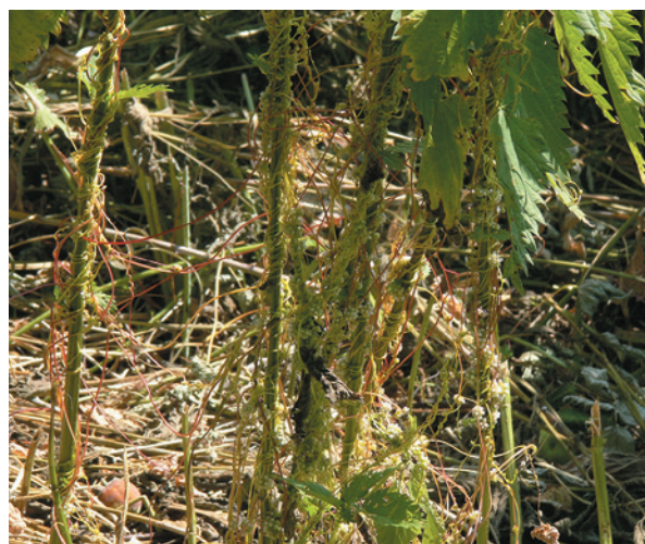
Рис. 2. Повилика европейская Cuscuta europaea L. на крапиве. Россия, Московская область

It can be noted that most Cuscuta spp. are autochthonous for the territory of Russia and occupy the entire habitat suitable for their existence, such as, for example, European dodder (Fig. 2). Nevertheless, some authors note the expansion of habitats and an increase in the abundance of harmful dodders, especially in the southern regions of Russia (Marikovskiy, Ivannikov, 1968). Apparently, this process is primarily associated with human activities, which leads both to the direct spread of the weed (through new transport routes, irrigation, etc.) and to the destruction of sustainable natural biotopes. Our observations in the Nurata Nature Reserve (Uzbekistan) can serve as an illustration of this conclusion. In this mountain reserve, which during the research covered about 30,000 hectares, there are 3 natural boundaries, approximately