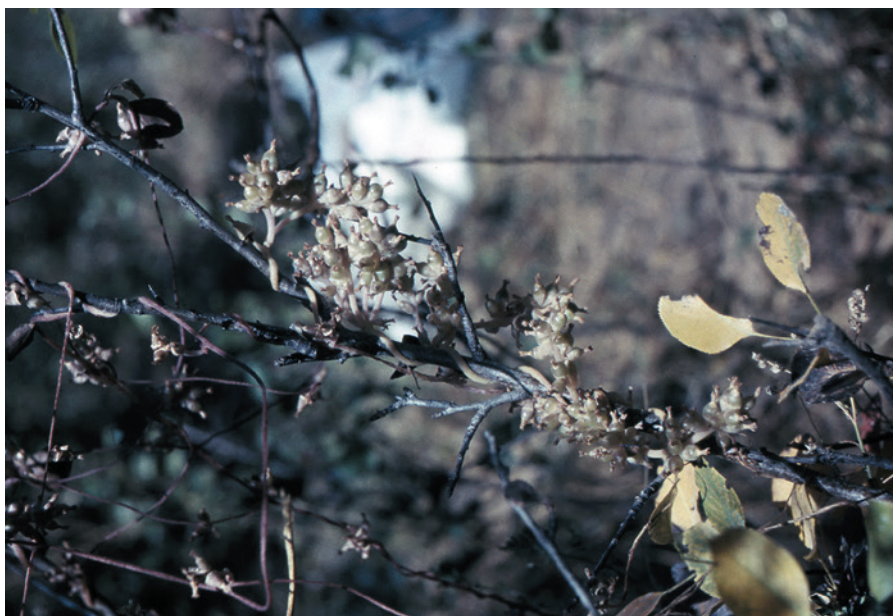
Рис. 5. Толстостебельная повилика с плодами на кустарнике. Узбекистан