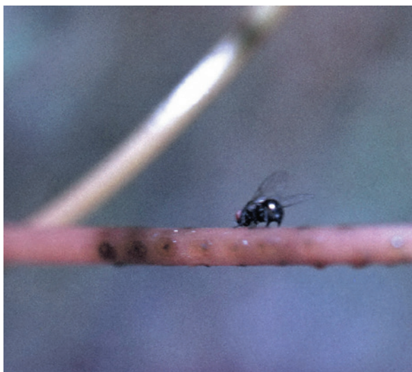
Рис. 10. Повиликовая муха Melanagromyza cuscutae Hering откладывает яйца в толстостебельную повилку. Берег реки Джабаглы. Казахстан