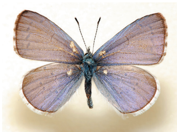
Рис. 7. Самец голубянки Celastrina argiolus (L.), выведен из гусеницы с плода толстостебельной повилики