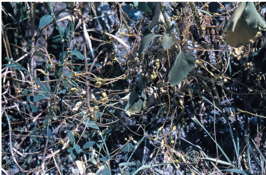
Рис. 4. Повилика полевая Cuscuta campestris Yunck. на дурнишнике Xanthium sp. с галлами повиликового долгоносика Smicronyx sp. Казахстан