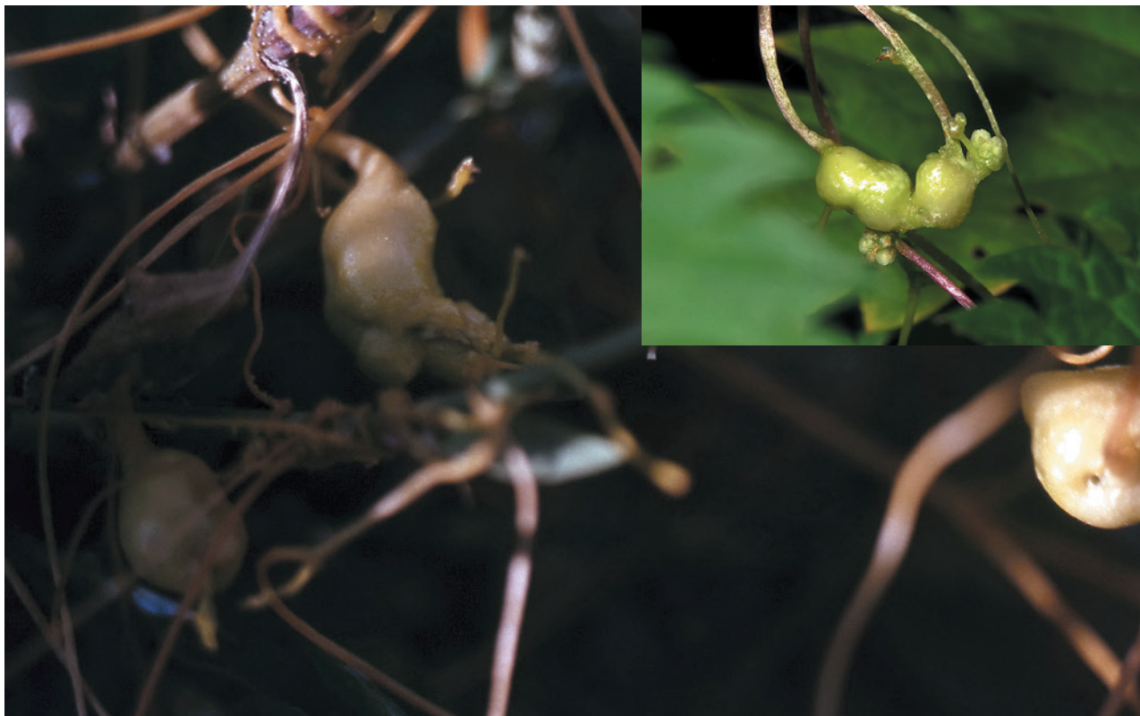
Рис. 9. Галлы повиликового долгоносика Smicronyx sp. на толстостебельной повилике, Казахстан (слева), и повилике европейской, Россия, Московская область (справа сверху). Справа внизу видно выходное отверстие в центре галла

The biology of the species of dodder weevils is similar. We studied it mainly in the Alma-Ata region of Kazakhstan. Weevils overwinter in the adult stage in the soil, they come to the surface depending on the temperature in late spring and early summer, additional feeding is carried out on the stems of dodders, and after mating, they lay eggs in the stems. With the interstitial feeding of the larvae, the section of the stem is transformed into a gall with a diameter of up to 2–3 cm