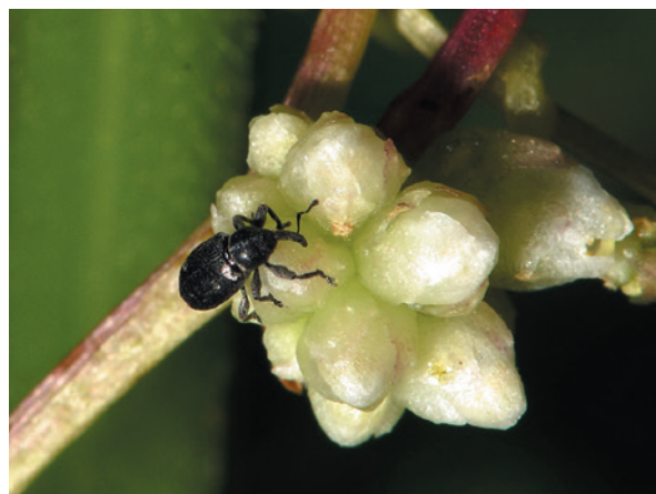
Рис. 8. Повиликовый долгоносик Smicronyx sp. на цветках повилики европейской. Россия, Московская область

Специализированный род Смикроникс семейства долгоносиков охватывает около 100 видов, распространенных в основном в Западном полушарии. В фауне жуков СССР насчитывалось 10 видов этого рода (Байтенов, 1974). Все представители