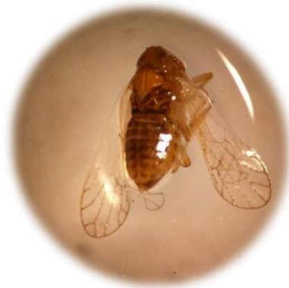
Figura 2. Cixiido Haplaxius crudus

H. crudus se caracterizó por presentar tres carinas en el protórax, alas hialinas, ojos conspicuos oscuros, segmento basal de la antena en forma de barril, espinas de la tibia agrupadas al final y las hembras son más grandes que los machos y ligeramente verdes en el abdomen. Tales resultados corroboran lo comentado por Carias (2006) y Horward y Gallo (2015).