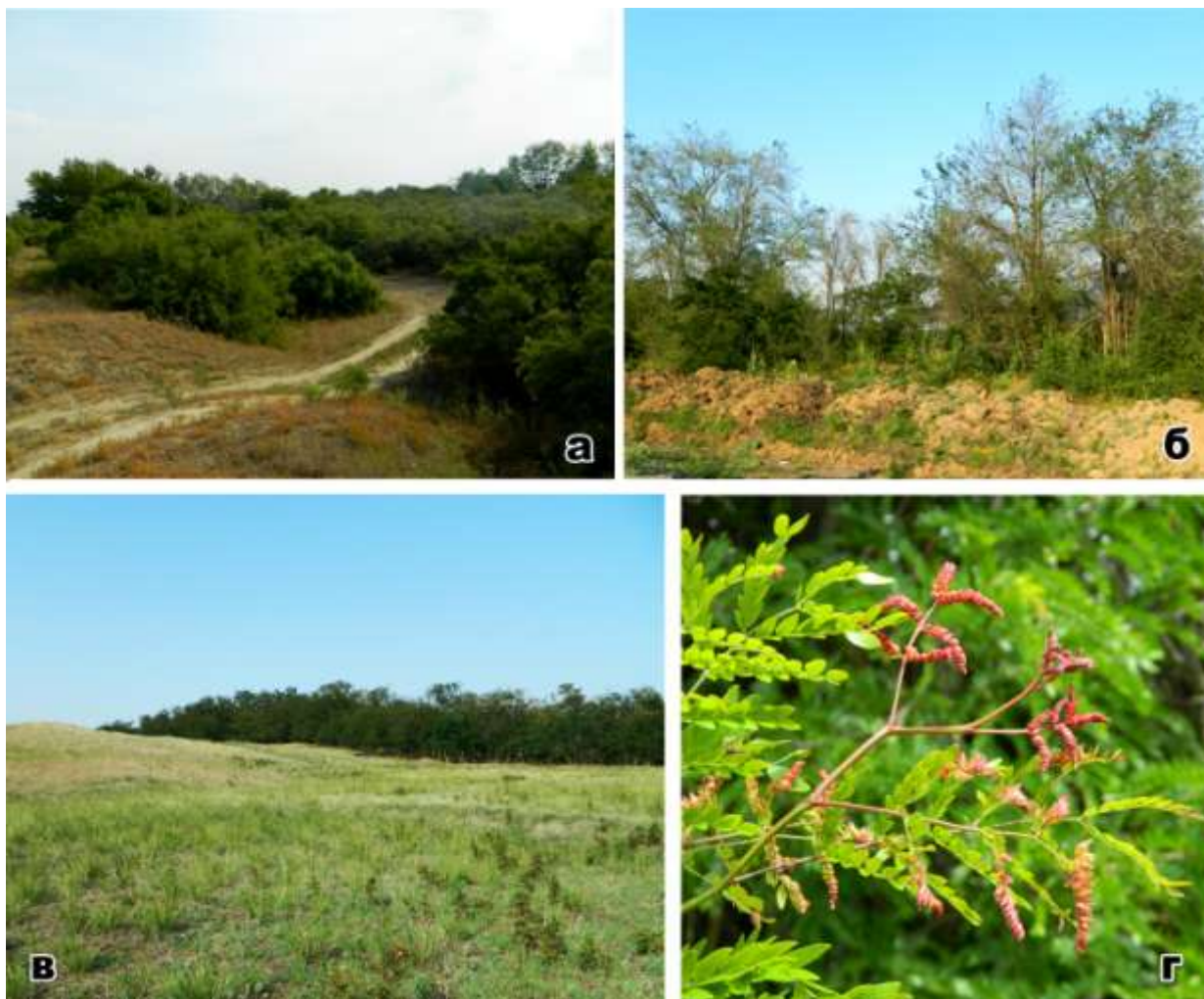
Рис. 3. Местообитания инвазивных насекомых-фитофагов на территории Предкавказья: а – очаг массового размножения Harmonia axyridis в зарослях тамарикса (окр. с. Урожайное, Ставропольский край); б – очаг массового размножения Aproceros leucopoda в придорожной ветрозащитной лесополосе из вяза приземистого (окр. г. Ростов-на-Дону); в – почвозащитные насаждения из робинии лжеакациевой, пораженные Bruchophagus robiniae , Parectopa robiniella и Obolodiplosis robiniae (окр. пос. Совхозный, Ставропольский край); г – массовое поражение побегов гледичии трехколочковой Dasineura gleditchiae (окр. станицы Староминской, Краснодарский край)

из Ростовской области, Краснодарского и Ставропольского края, Кабардино-Балкарии, Северной Осетии и Дагестана [Орлова-Беньковская, 2019]. На Кавказе отмечен нами до высоты 1124 м н.у.м (Республика Северная Осетия – Алания, Алагирский район, пос. Мизур). Энтомофаг, имаго также могут питаться спелыми плодами, нанося ущерб виноделию, виноградарству и плодоводству. Выявлен в Ростовской области, Ставропольском крае, Северной Осетии, Чечне, Дагестане. Очаги массового размножения отмечены в Дагестане (окр. с. Крайновка) и Ставропольском крае (окр. с. Урожайное), где имаго питались щитовками (предположительно Trabutina mannipara (Hemprich & Ehrenberg, 1829) на тамариксах (рис. 3а).