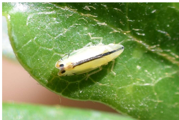
Figura 1. Sophonia orientalis . Zoobotánico Jerez, 29.VI.2019.

bajo hojas de P. tobira , P. crassifolium y A. altissima ; Leg. y det.: Í. Sánchez. ídem, Area Sur, 29SQA56, numerosas ninfas, 01.V.2020, bajo hojas de Ricinus communis L. (Familia Euphorbiaceae); Leg. y det.: Í. Sánchez.