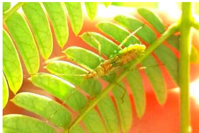
Figura 8. Zelus renardii . Sevilla, 29.IX.2019.

La expansión de este reduvido neártico en la península ibérica y en el mundo han sido analizadas recientemente por Rodríguez Lozano et al. (2018) proponiendo diversas hipótesis que pueden explicar su distribución mundial e ibérica. En la región mediterránea su área de distribución se sigue ampliando y ya ha alcanzado la costa mediterránea de Francia (Garrouste 2019). En España la situación es similar y recientemente se ha citado de Barcelona, Castellón, Madrid y