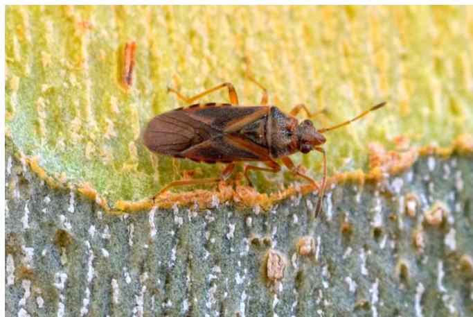
Figura 6. Arocatus longiceps . Zoobotánico de Jerez, 12.VI.2019.

Especie arborícola y oligófaga que se alimenta principalmente de los frutos de su huésped, los árboles del género Platanus L. (Péricart 1999). Su ciclo biológico comprende la hibernación en estadio adulto, puestas primaverales y nuevos adultos a lo largo del verano (Péricart 1999).