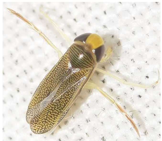
Figura 10. Trichocorixa verticalis verticalis . Punta Entinas, 25.VII.2019.