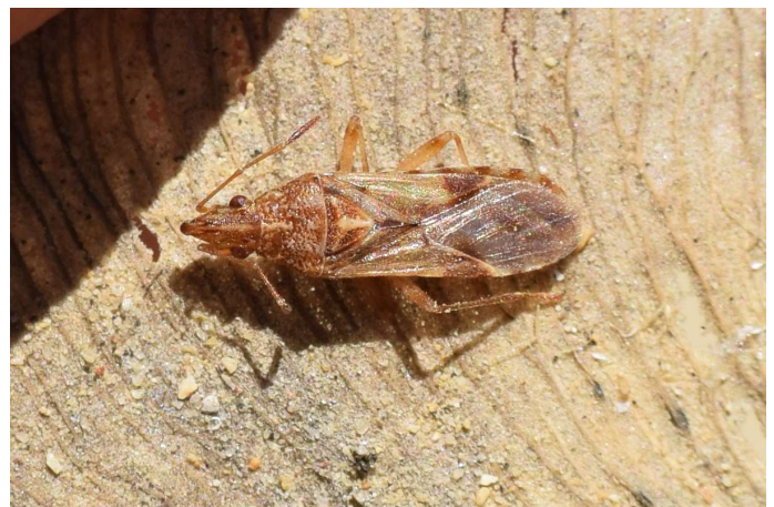
Figura 7. Belonochilus numenius . Jerez de la Frontera, 25.VI.2019.