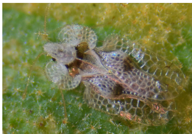
Figura 5. Corythucha ciliata . Sevilla, 19.VIII.2017.

Aunque existen algunas lagunas en la distribución ibérica de C. ciliata pensamos que debe estar repartida en toda la península. Ha pasado a ser una especie más de nuestra fauna que ya no despierta el interés de entomólogos profesionales y aficionados. Corythucha ciliata es una importante plaga del arbolado urbano, plátanos de sombra especialmente, al que causa problemas considerables. Los tratamientos fitosanitarios contra el tigre del plátano son una de las tareas rutinarias que ahora asumen los departamentos de jardinería de muchos ayuntamientos españoles. Estos tratamientos son también ofertados por empresas de control de plagas y algunos gobiernos regionales han publicado interesantes guías para el manejo y control de la especie (Martín Bernal et al. 2000). El Ayuntamiento de Gerona, primera ciudad en la que se detectó la especie, ha iniciado el control de la plaga con métodos biológicos más respetuosos con el medio ambiente (La Vanguardia 2017)