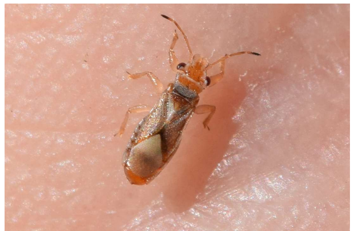
Figura 4. Thaumastocoris peregrinus . Zoobotánico Jerez, 29.VI.2019.

Esta especie, originaria de Australia, se ha citado en diversas partes del mundo como plaga de varias especies de eucalipto, principalmente del eucalipto rojo ( Eucalyptus camaldulensis Dehnh., familia Myrtaceae). Fue descrita a partir de ejemplares recolectados en cultivos de eucaliptos en