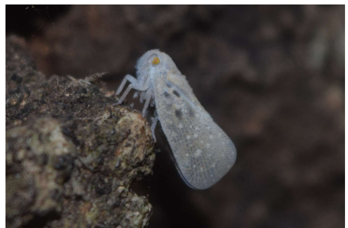
Figura 2. Metcalfa pruinosa . Garganta del Capitán 16.VII.2017.

La primera cita en Europa de este Flatidae originario de América del Norte fue en Italia, en la provincia de Treviso (Zangheri & Donadoni 1980) y, desde ahí, se fue extendiendo