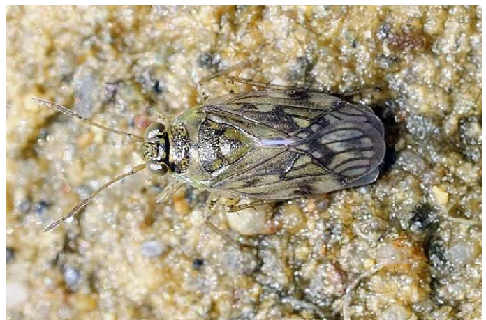
Figura 9. Pentacora sphacelata . Punta Entinas, 06.X.2012.

El género Pentacora reúne once especies (Larivière & Laroche 2019) que se distribuyen de forma disjunta por las regiones Neártica, Neotropical, Oriental y Australasia. Cinco se conocen de la región Neártica, una, P. sphacelata , vive en las regiones Neártica y Neotropical y ha sido introducida en la región Mediterránea Occidental, las restantes cinco especies viven en diferentes partes de las regiones Oriental y Australasia (Cobben 1980). A excepción de dos especies, P. ligata (Say, 1832) y P. ouachita Polhemus, 1993, el resto vive en hábitats halófilos (Polhemus 1993). P. sphacelata es el primer ejemplo de especie invasora de heterópteros en la Península ibérica. Se describió como nueva especie ( P. iberica Wagner, 1953) sobre un ejemplar de Alfacs en Tarragona (Wagner 1953) y en la región Paleártica se conoce del Mediterráneo occidental en la península ibérica, Cerdeña y el Norte de África: Marruecos (Péricart 1990; Lindskog 1995) y Túnez (Ponel et al. 2015). En la península ibérica se distribuye por las zonas costeras mediterráneas y atlánticas desde el Prat de Llobregat hasta Coímbra (Péricart 1990).