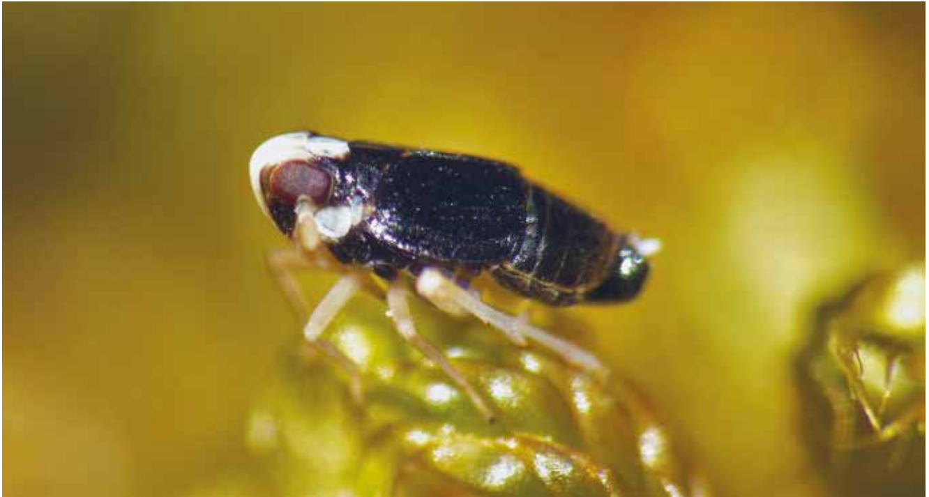
Figuur 1. Mirabella albifrons (man), Nationaal Park Hollandse Duinen, Berkheide, 19 april 2018.