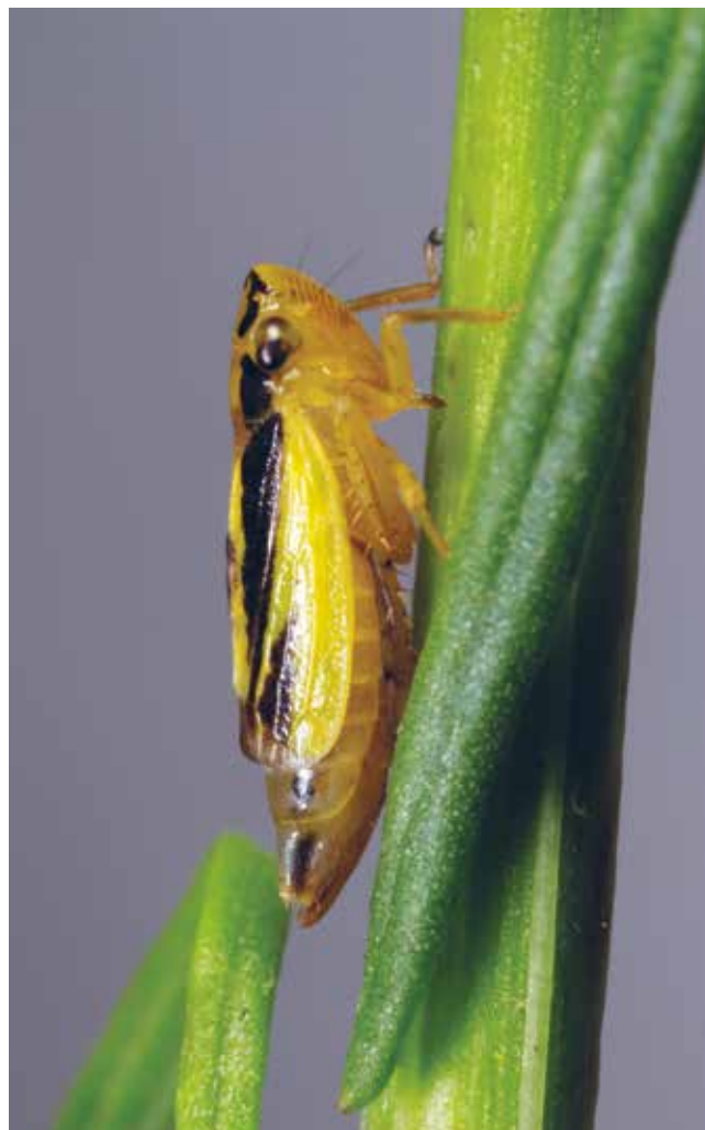
Figuur 3. Evacanthus interruptus (vrouw), Nationaal Park Hollandse Duinen, ZW-Berkheide, 29 juni 2017 op Bezemkruiskruid.

De bodembewonende Anaceratagallia frisia komt voor op open warme plekken waar de vegetatie niet volledig gesloten is. Het is een zeldzame soort die in ons land alleen in de duinen aangetroffen wordt op plekken met Buntgras ( Corynephorus canescens ) en Zwenkgrassoorten ( Festuca sp.). De waardplanten van A. frisia zijn niet goed bekend, een relatie met vlinderbloemige planten wordt verondersteld (Nickel 2003). Het is een soort waarvan de verspreiding beperkt is tot NW Europa: Noord Duitsland, Nederland en mogelijk Engeland. In het NP is deze soort op drie locaties in bodemvallen gevangen. Mogelijk zal blijken dat deze soort meer voorkomt in de Hollandse Duinen als vaker gebruik gemaakt wordt van bodemvallen. Bodemvallen zijn voor de meeste cicaden niet echt een geëigende vangstmethode, maar het werkt erg goed voor de kleine groep van bodembewonende cicaden. De levenscyclus is