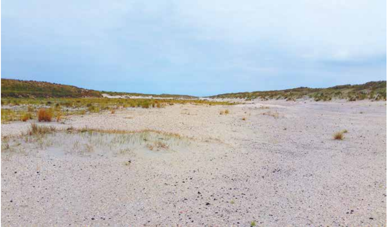
Figuur 5. Nationaal Park Hollandse Duinen, 's Gravenzande, 7 juli 2018, vindplaats Doratura impudica .