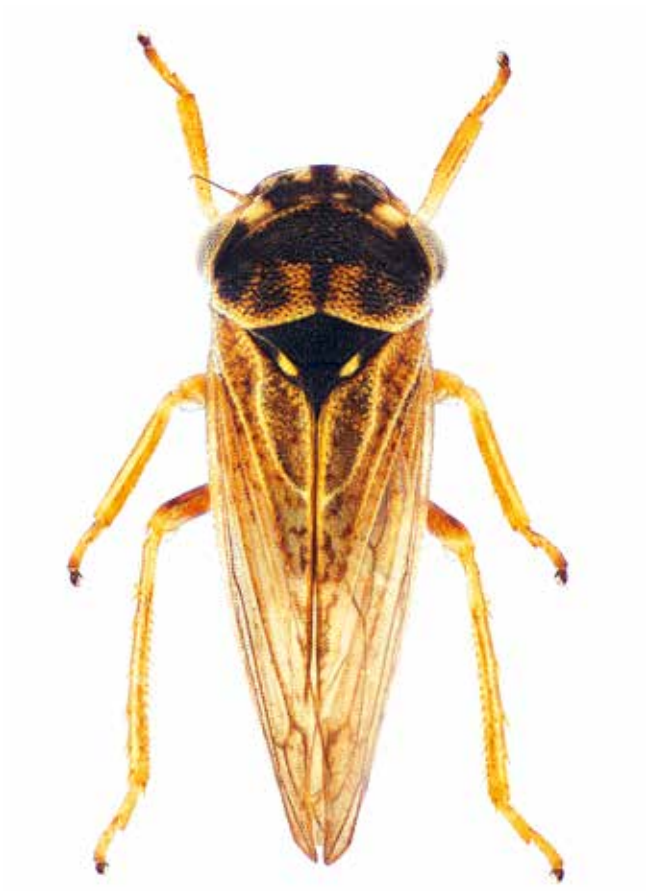
Figuur 2. Megophthalmus scabripennis (man), Bedoin (Frankrijk: Vaucluse), 20 mei 2013, genitaliën verwijderd.

grassen) voorkomt. Laodelphax striatellus staat in veel delen van de wereld bekend als plaaginsect, in Europa is het een overbrenger van verschillende virussen die plantenziekten in landbouwgewassen (haver, maïs, rijst en tarwe) veroorzaken. In Europa is alleen de overdracht van maïze rough dwarf virus (MRDV) van economisch belang. Dit virus kan grote schade aanrichten in maïsvelden in zuidelijk Europa. Laodelphax striatellus heeft twee generaties per jaar en de larven overwinteren op de waardplant.