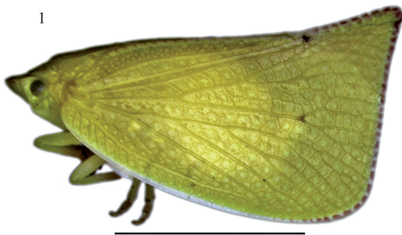
Figura 1. Siphanta acuta (Walker). Hembra de Rapa Nui (Chile), vista lateral. Escala: 5 mm.

Colectas realizadas en Rapa Nui (Isla de Pascua) por el Servicio Agrícola y Ganadero (SAG) desde 1998 y registros recientes (Fig. 1), dan cuenta que esta especie se encuentra establecida en esta localidad de Chile insular. Considerando el potencial transporte entre la isla y el continente interesa conocer la susceptibilidad de Chile continental a la invasión por S. acuta .