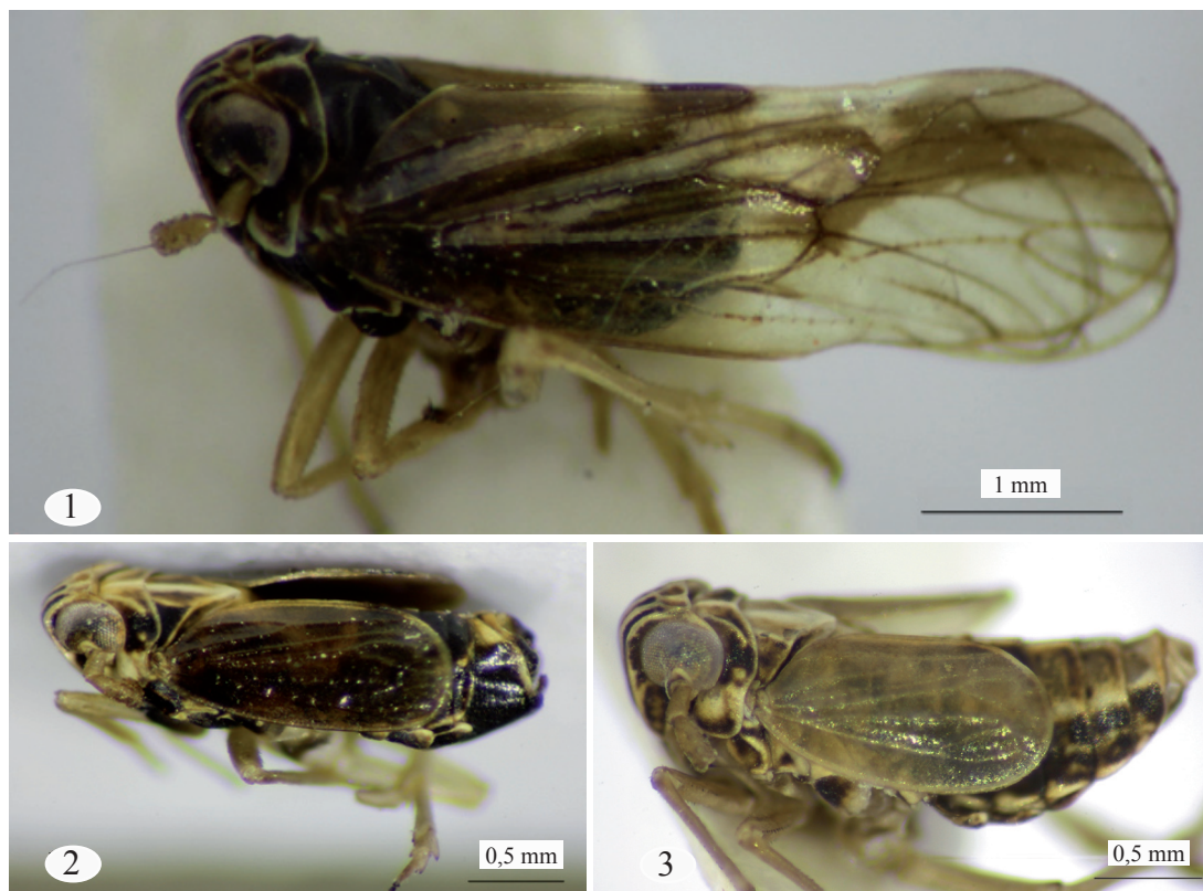
Figs. 1-3. 1, Macho macróptero Vista lateral. 2, macho braquíptero Vista lateral. 3, Hembra braquíptera Vista lateral.

ma del aedeagus del macho y de la escama genital de la hembra (Guglielmino et al , 2016).