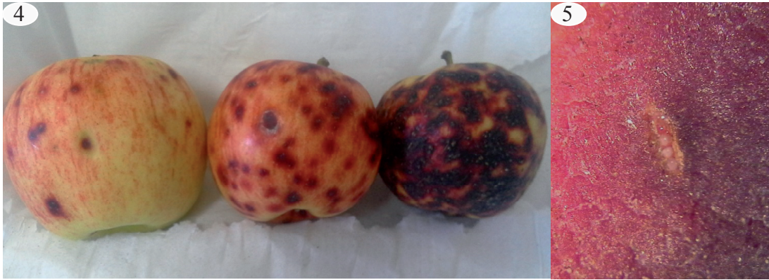
Figs. 4 y 5. 4, frutos con distinto nivel de daño. 5, postura endofítica en fruto (ampliada).

hojas y yemas aledañas no presentaron lesiones.