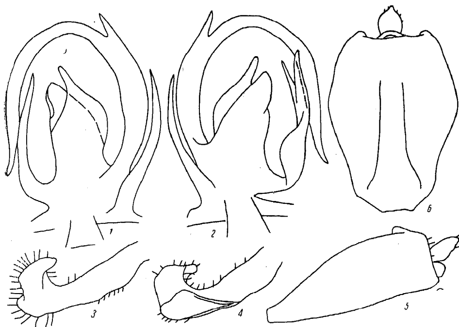
Рис. 1. Ollarus verrucosus sp. n.:

вый. Антеклипеус светлый, беловатый. Виски под глазками бурые или буроватые. Глаза бурые, глазки окаймлены бурым. Усики буроватые, основания и вершины члеников темнее, жгутик бурый. Переднеспинка светлая, желтоватая или зеленоватая. Наплечники светлые. Щиток черный, блестящий с одноцветными киями; задний его угол светлый, беловатый. Надкрылья прозрачные, иногда немного дымчатые, с дымчатыми или буроватыми жилками, усаженными бугорками с буроваты-