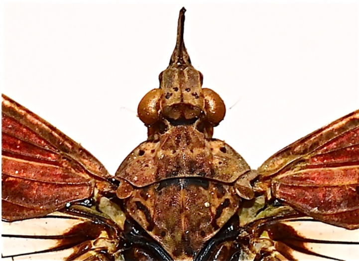
Fig. 3. - Prolepta celebensis n. sp.: tête et thorax (vue dorsale).