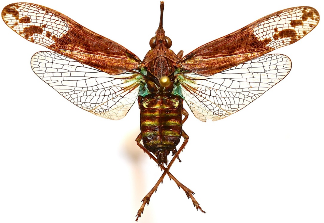
Fig. 7. - Prolepta ferocula (Stål, 1863), C. Sumatra (Jambi), 38 mm (MHNL)