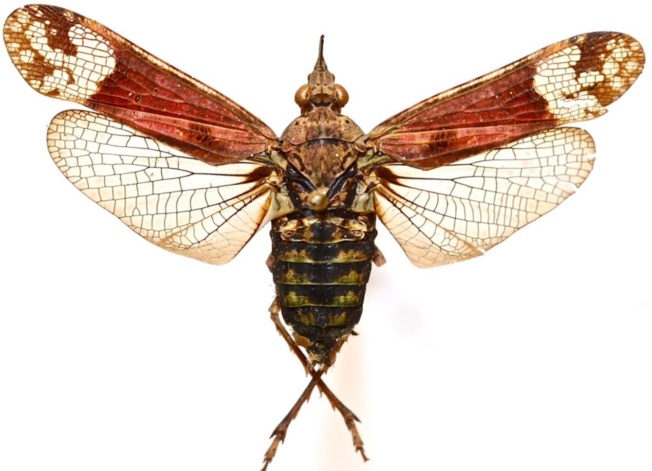
Fig. 8. - Prolepta celebensis n. sp., holotype ♀, Sulawesi, 39 mm (MHNL)