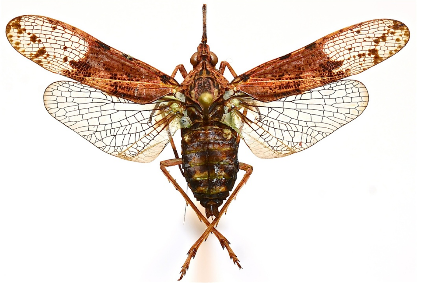
Fig. 5. - Prolepta ferocula (Stål, 1863), E. Kalimantan (Mt Bakayan), 43 mm (MHNL)