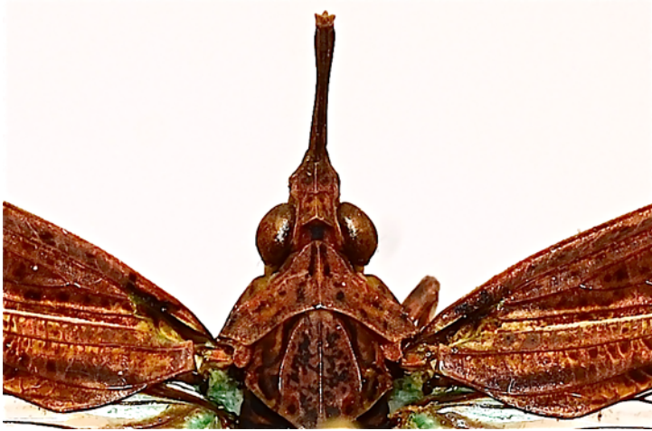
Fig. 1. - Prolepta ferocula (Stål, 1863): tête et thorax (vue dorsale).