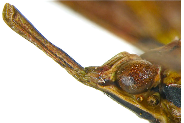
Fig. 2. - Prolepta ferocula (Stål, 1863): vue latérale de la tête et du processus céphalique.