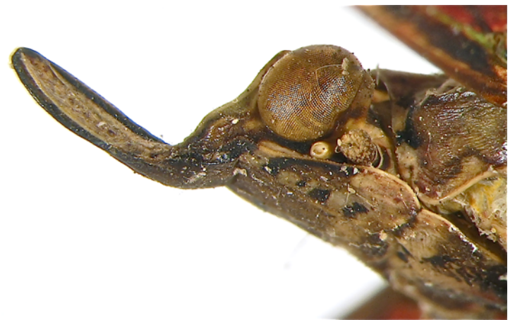
Fig. 4. - Prolepta celebensis n. sp.: vue latérale de la tête et du processus céphalique.

Derivatio nominis: Le nom de l'espèce est donné en référence aux Célèbes, autre nom de Sulawesi.