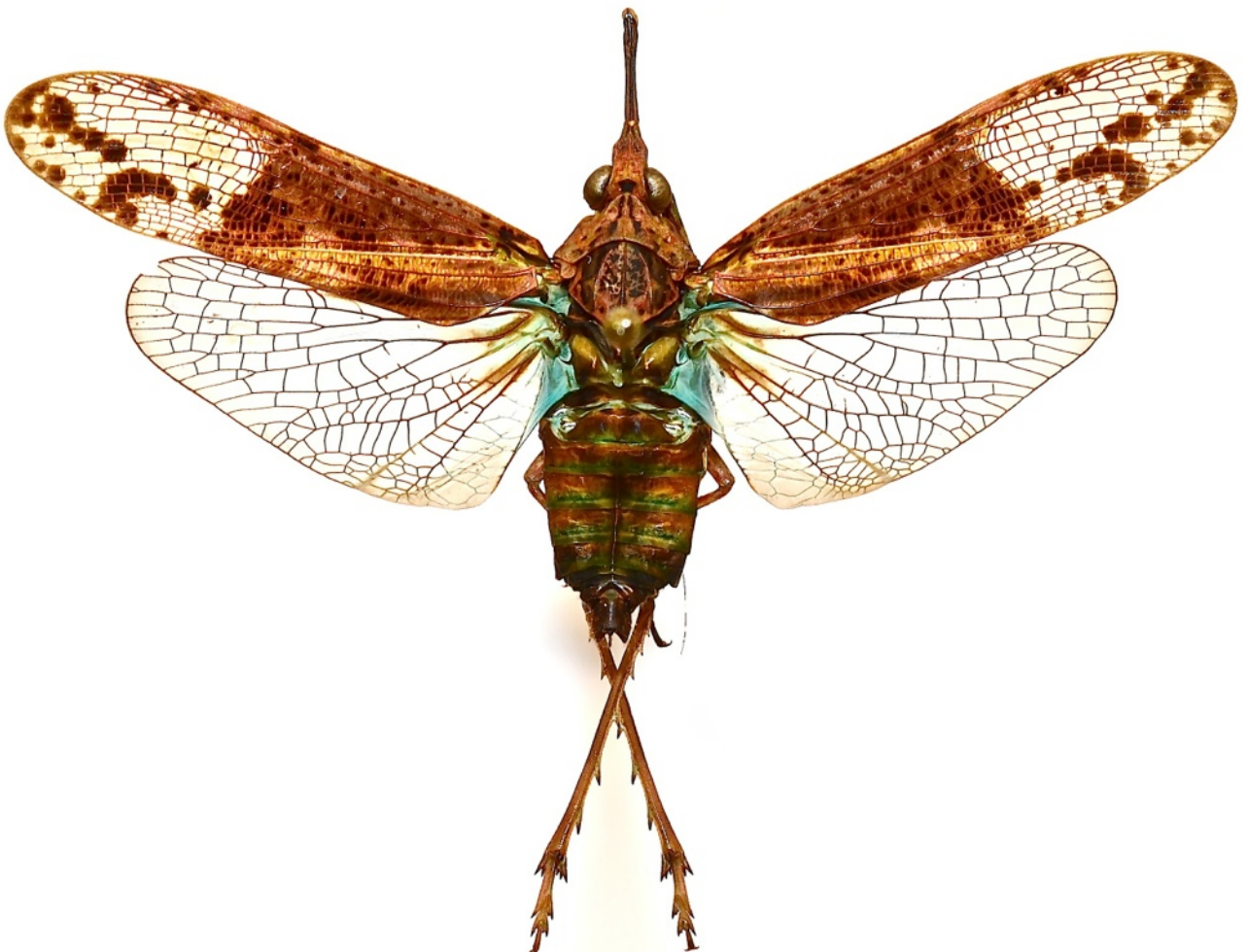
Fig. 6. - Prolepta ferocula (Stål, 1863), E. Sumatra (Palembang), 40 mm (MHNL)