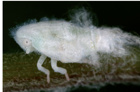
Abb. 4. Larve der Bläulingszikade Metcalfa pruinosa (Say, 1830), Steiermark, 12.8.2007.