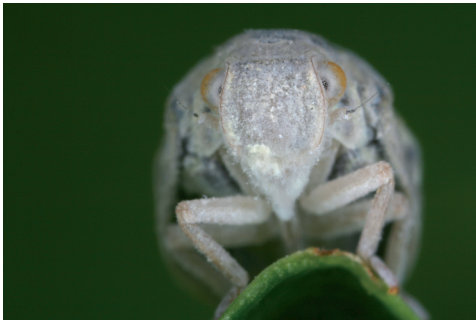
Abb. 3. Porträt desselben Individuums wie auf Abb. 2.