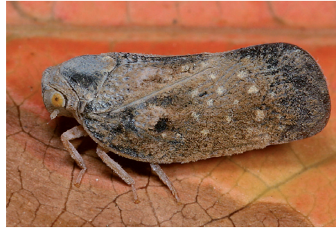
Abb. 2. Adulte Bläulingszikade Metcalfa pruinosa , Steiermark, 3.8.2007.