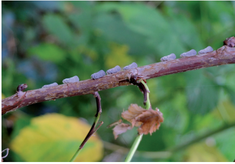
Abb. 1. Ersthfindung der Bläulingszikade Metcalfa pruinosa (Say, 1830) in Deutschland (Mutterstadt, 28.7.2012).