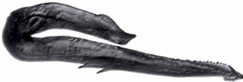
Ryc. 2. Aedeagus Aphrodes makarovi ZACHVATKIN, 1948

Polifag, higrofilny, zimuje w stadium jaja, jedna generacja w ciągu roku, gatunek europejski (NICKEL & REMANE 2002, GĘBICKI et al. 2013). Cechą charakterystyczną dla A. makarovi jest stosunkowo krótki aedeagus o wygiętym trzonie (przy widoku bocznym), którego wyrostki wyraźnie zachodzą na siebie (ryc. 2) (OSSIANNILSSON 1981).