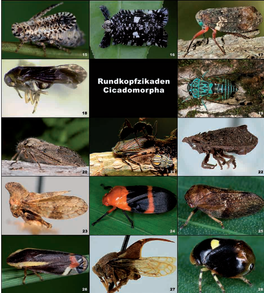
Abb. 2: Fulgoromorpha: (15) Trypetimorpha occidentalis (Tropiduchidae), (16) Elasmoscelis platypoda (Lophopoidae) ©Joana Garrido, (17) Chewobrachys sanguiflua (Eurybrachidae) ©Jerome Constant, (18) Achilixius sp. (Achilixiidae) © National Museum Wales. Cicadomorpha: (19) Zammara smaragdina (cf.) (Cicadidae), (20) Tettigarcta tomentosa (Tettigarctidae) ©Alexander Dudley, (21) Aetalion reticulatum (Aetalionidae), (22) Myerslopidae indet. (Myerslopidae) ©Margaret K. Thayer, (23) Llanquihuea pilosa (Melizoderidae) ©James Zahniser, (24) Tomapsis praeminiata (cf.) (Cercopidae), (25) Epipygidae indet. (Epipygidae), (26) Microsargane vittata (Aphrophoridae), (27) Machaerota coomani (Machaerotidae), (28) Clastopteridae indet. (Clastopteridae).

pflanze. Die ca. 120 beschriebenen Arten besitzen wie auch die Clastopteridae ein deutlich längeres als breites Mesonotum, das bei den Machaerotidae oft zu einem charakteristischen nach hinten gerichteten Scutellarfortsatz ausgebildet ist (Abb. 2). Ihre Vertreter sind ausschließlich auf die Tropen der Alten Welt und Australiens beschränkt.