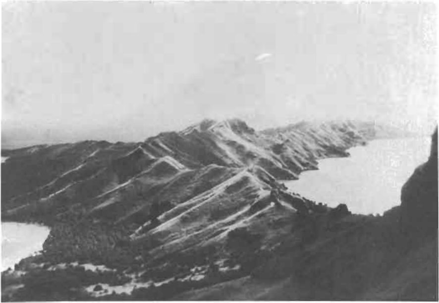
Fig. 3. - Le milieu. Vue générale de l'île Mangereva, vers l'est, prise du haut du Mont Mokoto: à gauche la baie de Gatavake, à droite celle de Rikitca. Les collines ont perdu toute végétation arborescente.