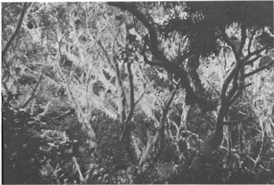
Fig. 2. - Le milieu . Petite forêt humide installée au pied du Mont Duff; les branches des arbres sont couvertes de lichens chevelus; c'est le biotope de Nesolyncides FENAGH. ( Dictyopharidae ).