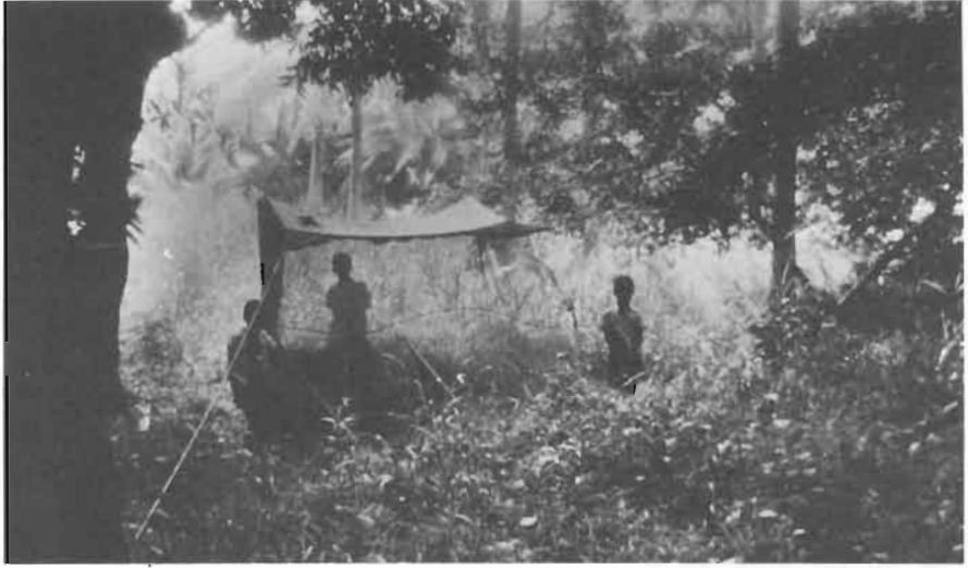
Fig. 7. - Les procédés de récolte : le piège de Malaise. Il est ici installé au débouché d'une clairière, entre un arbre et un taillis; les insectes se dirigeant vers la lumière sont capturés par le piège.