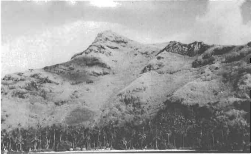
Fig. 5. - Le milieu . Peuplement de Miscanthus floridulus sur les pentes; cocoteraie en bordure de mer.