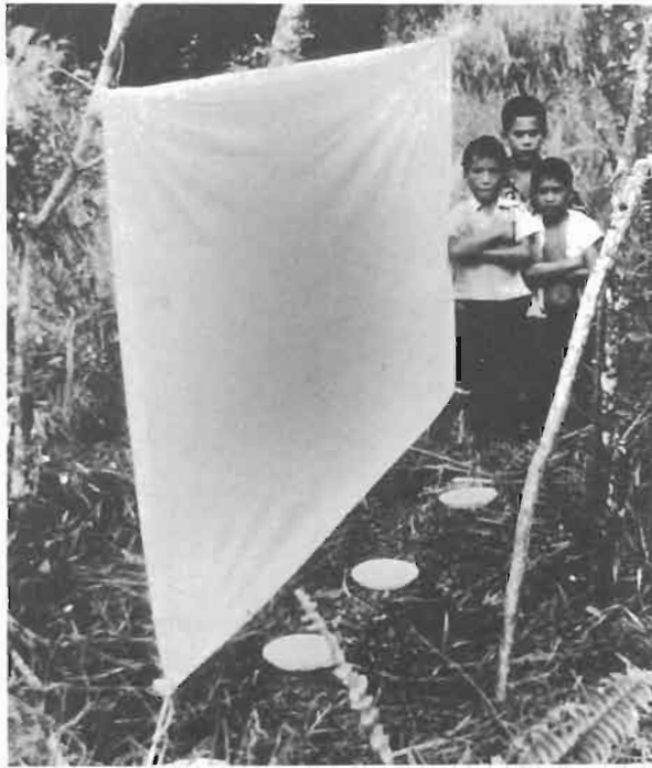
Fig. 8. - Les procédés de récolte : assiettes jaunes emplies d'eau teepolée en association avec une toile blanche attractive, et, de nuit, deux lampes à incandescence.