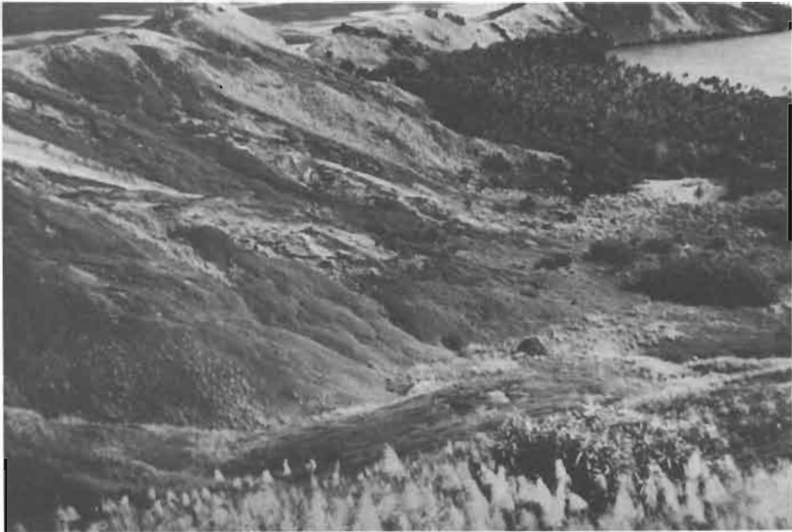
Fig. 4. - Le milieu. Baie de Gatavake bordée de cocotiers. Les pentes sont couvertes de fougères et de Miscanthus et par endroits profondément ravinées.