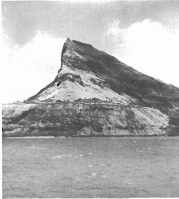
Fig. 1 - Le milieu . Le Mont Duff (441 m), vestige d'un ancien cratère, présente sur sa face sud une falaise verticale au pied de laquelle s'est instauré un biotope très particulier.