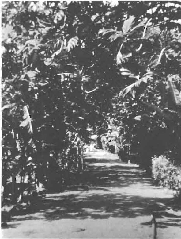
Fig. 6. - Le milieu . Allée principale du village de Rikitea, ombragée par les arbres à pain ( Artocarpus ) et bordée de fleurs ornementales ( Hibiscus , Tagetes , etc.).